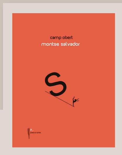
SALVADOR, Montse. Camp obert . Girona: Llibres del Segle, 2019. 64 p.

amb sis lletres ens obre un món generador de vida, de pensament, d'autocoïneixement. I, al final, un poema més llarg, «Terra», on l'autora es permet fer un retorn puntual als nostres clàssics amb una composició de reminiscències patriòtiques.