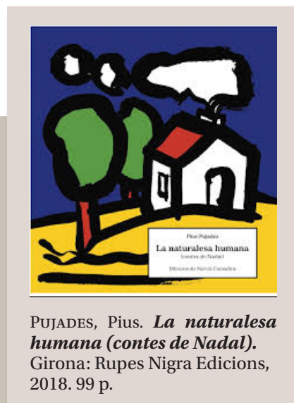
PUJADES, Pius. La naturalesa humana (contes de Nadal) . Girona: Rupes Nigra Edicions, 2018. 99 p.