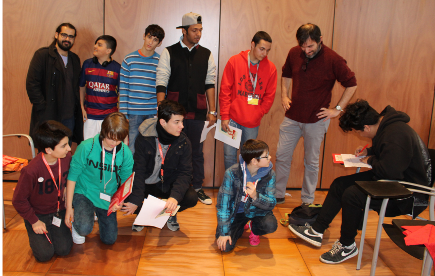
>> Tallers amb grups de nois de secundària organitzats per Homes Igualitaris.

ment de Barcelona, 2006—), amb dones com Maria Aurèlia Capmany, i que va donar pas a l'exili viscut per feministes proclamades com Mercè Rodoreda i, en terres gironines, Aurora Bertrana o Carme Montoriol. En el camp de l'activisme, hi ha exemples com el de Neus Català, Teresa Pàmies i Frederica Montseny, totes elles empresonades en els foscos anys de dictadura. Aquesta darrera va ser la primera dona ministra a l'Estat espanyol, any d'infaust record que va convocar un llarg silenci, sobretot per a les dones. Un silenci convertit en paraula del moviment de les dones del 36, que es va reprendre durant la transició i que va representar un feminisme combatiu, matriu veritable del moviment lila actual.