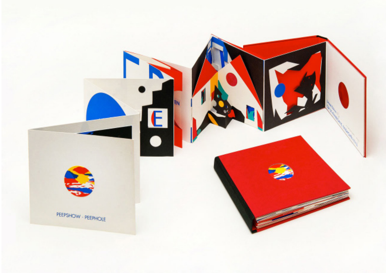
>> Peep Show, Peep Hole, 2005. Serigrafia i collage, 14 x 17 cm. (Autoria: QUIM COROMINAS)

Li demano si les fàbriques de paper de Sarrià de Ter han estat determinants en aquesta predisposició a retallar-lo, a encolar-lo, a fer-ne matèria primera de la seva obra, i em contesta que ja se li ha dit, però no pot deixar de desgranar els records d'infància de quan jugava amb les bales de paper premat esbardellades, amb la pluja desbordada de tota mena de papers i textures, d'imatges i lletres inesperades, dels sons dels papers, dels gramatges, a prop d'una mítica empresa paperera ja desapareguda: Can Butinyà. Hi ha un altre punt de referència vital en la trajectòria de l'obra de Corominas, l'atac de cor i la subsegüent operació, delicadíssima, al gener de 2014, que l'ha tingut en una mena de stand by creatiu, de càmera lenta, que ha conclòs amb les peces de grans dimensions per a l'exposició del castell de Benedormiens.