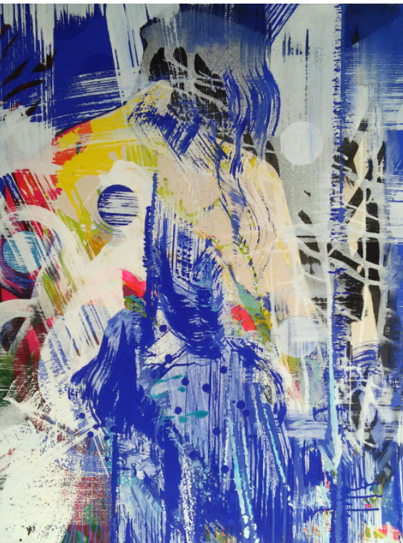
>> Nit de llunes i estels, 2016. Acrílic sobre tela, 130 × 97 cm. (Autoria: QUIM COROMINAS)