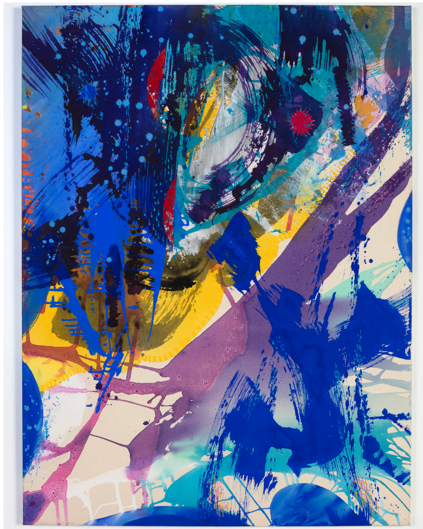
>> Transfiguració, 2018. Acrílic sobre tela, 100 × 81 cm. (Autoria: QUIM COROMINAS)

dels colors per muntar o suggerir imatges que poden o no percebre's o comparar-se amb la realitat, amb la natura. Sí, el seu traç tècnic ja és un estil propi, una sintaxi modular en què es reconeixen molts recursos propis. Potser els més evidents i obstinats són els colors capitanejats pel blau Montserrat de Químics Dalmau, un pigment blau elèctric de tast mediterrani, fred, profund i mal-leable, com el que apareix en peces com Transfiguració , en què la gran massa de blau pentinat es baralla amb el blanc, el color de tots els colors, per evocar, guiats pel mànec d'un pinzell, un personatge, boirós; tots els colors s'estratifiquen en capes, en sediments constructors que parteixen del primer cop d'ull, en què tot sembla una invenció abstracta, una casualitat gestual informe que, amb observació pausada, esdevé la gènesi d'una història visual imparable, que s'adherirà a la nostra percepció. Una pintura de Corominas sempre comença amb un cop visual en aparent caos i, més tard, s'assenta en el subconscient de l'espectador. Evidentment, el joc formal i gestual que es propicia des d'un blau elèctric es contraresta amb la calidesa dels vermells, dels grocs; és probable que en l'obra