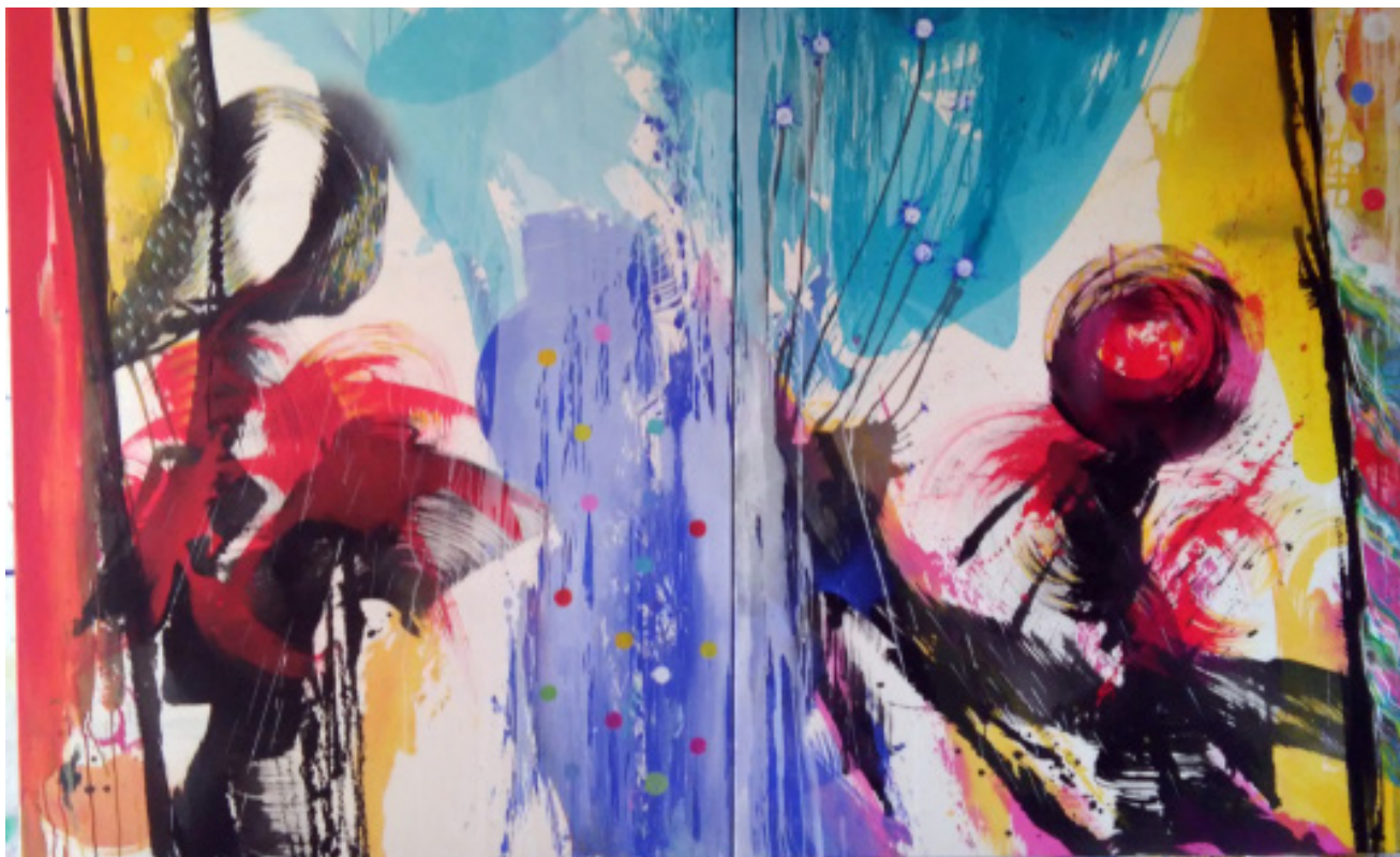
>> El circ, 2019. Acrílic sobre tela, 145 x 230 cm. (Autoria: QUIM COROMINAS)

poldt, que el va ajudar quan es llançava decidit a la creació d'un llenguatge personal molt afí a l'expressionisme abstracte, que el va salvaguardar i que encara, avui dia, ressona, insistentment, en la seva producció d'obra sobre tela.