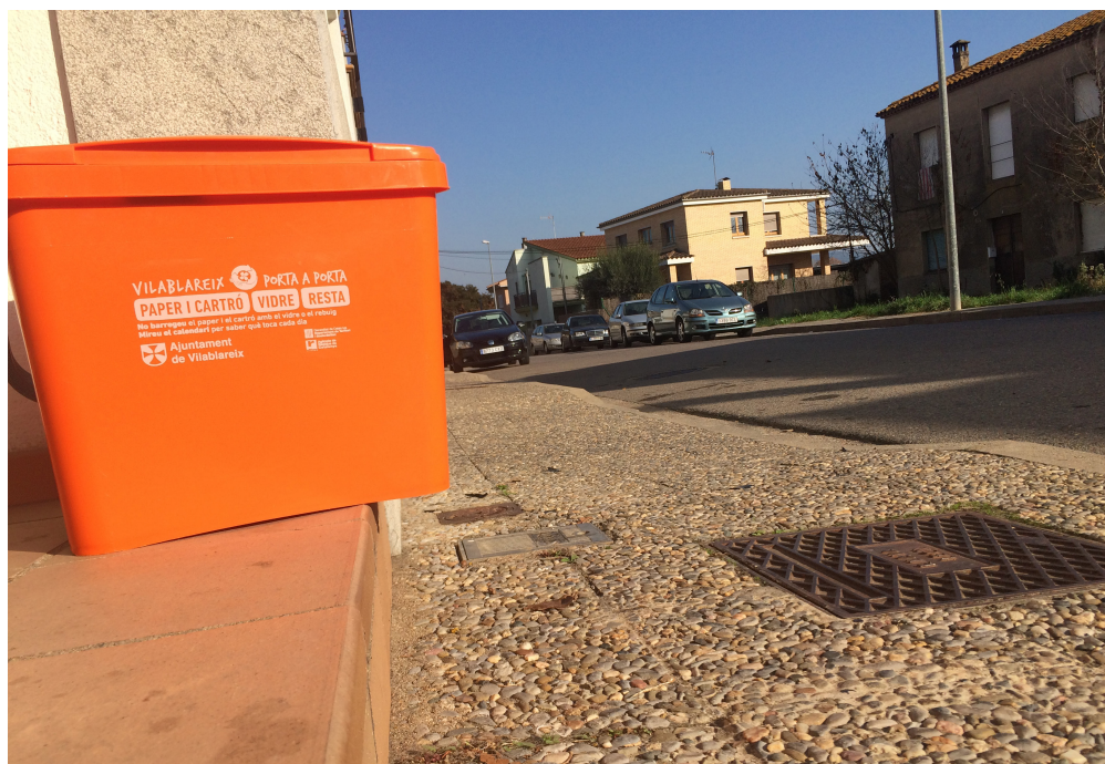
>> Cubell per a la recollida del paper, vidre i resta.

Les freqüències de recollida són les següents: orgànica, tres vegades per setmana; envasos, dues vegades per setmana; vidre i resta, quinzenalment;