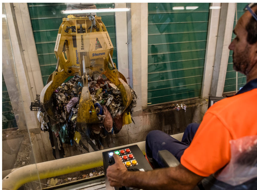
>> Zona de recepció de la fracció resta.

No serà fàcil ni ràpid, però el que no té futur és seguir actuant com fins ara, sense fer cap canvi en la nostra conducta a fi de millorar la gestió dels residus, i això passa, abans que res, per una reducció significativa. Aquest és un pas més per avançar de manera segura cap a la nova realitat que sortirà del canvi global en el qual estem immersos.