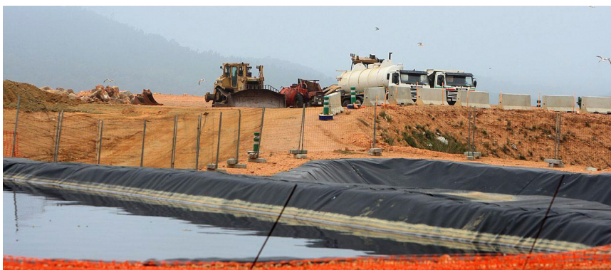
>> Abocador de residus de Solius.

El canvi de paradigma s'ha anat gestant en l'últim segle i aquest procés ha comportat l'abandonament de la vida rural i un augment de la vida a les ciutats (fins al 50 % o més de la població resideix avui a les ciutats i es calcula que el 2050 arribarà al 80 %). Paral·lelament a aquesta urbanització del territori (que podem entendre com un canvi de fase en el paisatge), s'ha produït un efecte tant o més important pel que fa a la percepció de la realitat en la ciutadania, relacionada amb l'allunyament del món natural. Aquest allunyament dificulta entendre el funcionament dels ecosistemes, al mateix temps que impedeix percebre el fort lligam que, com a individus i societat, tenim amb els sistemes naturals. En darrer terme, ens fa pensar que els recursos són il·limitats i que en el futur la tecnologia podrà solucionar