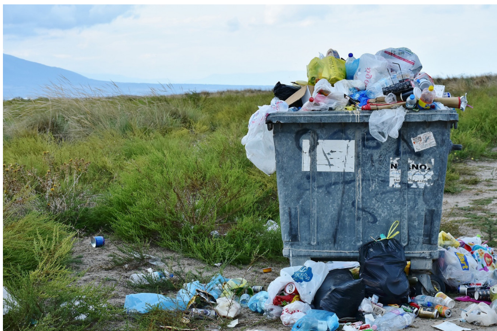
>> Contenidor d'escombraries.