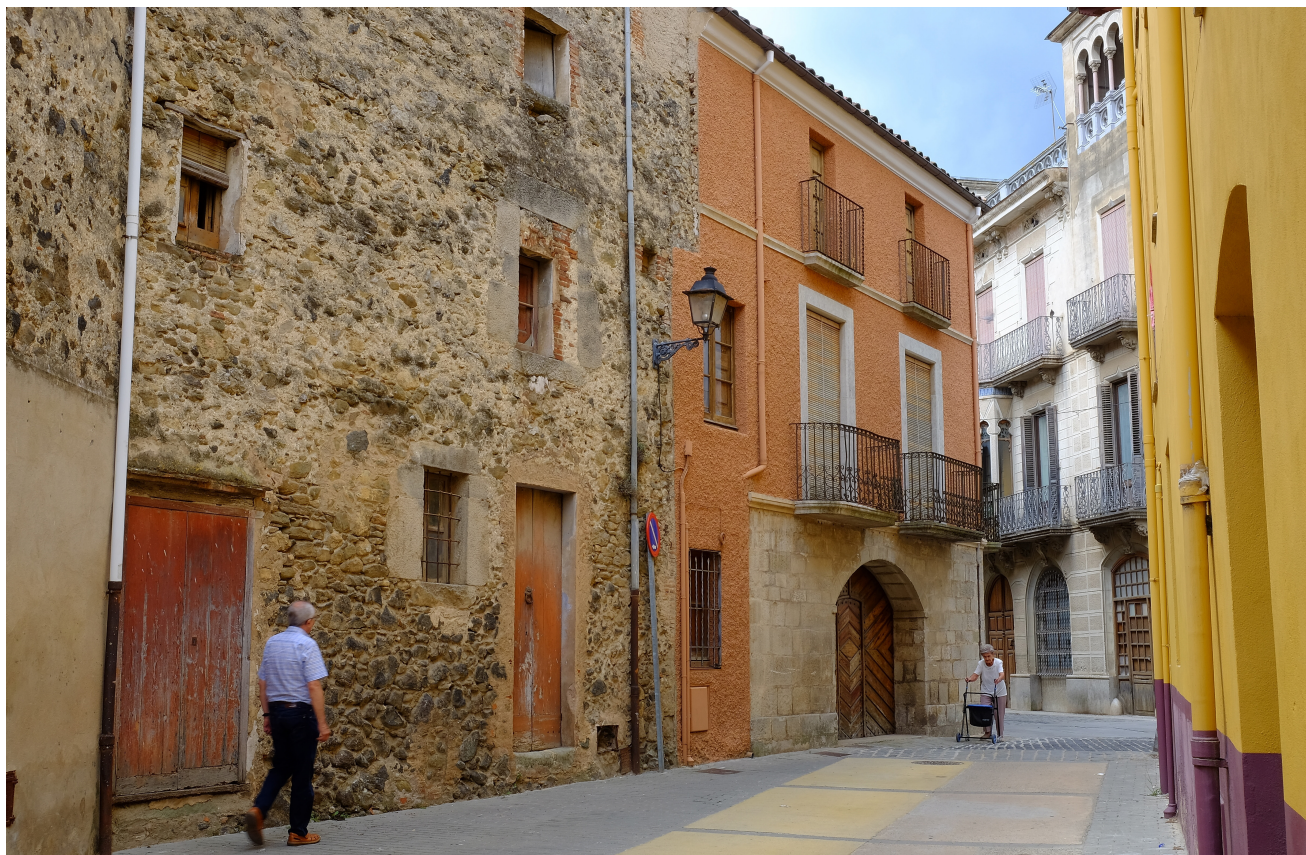
>> Edificis de Sant Feliu de Pallerols que, segons Del Molar, l'autor del llibre, podrien haver allotjat la Cúria Reial, on Torrent va declarar i va sofrir tortures. (Autoria: ERNEST COSTA)

utilitzava «art i inducció de l'esperit maligne».