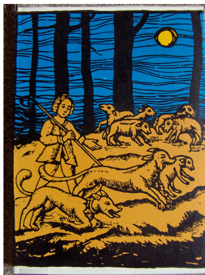
>> Edició de Procés d'un bruixot de l'any 1980 per l'editorial Miquel Plana. Es van publicar 365 exemplars amb el mateix text que l'original però amb un format i una mida diferents.

que ningú no havia de declarar contra si mateix, però la Inquisició obligava a fer-ho fins i tot coaccionant i enganyant els acusats.