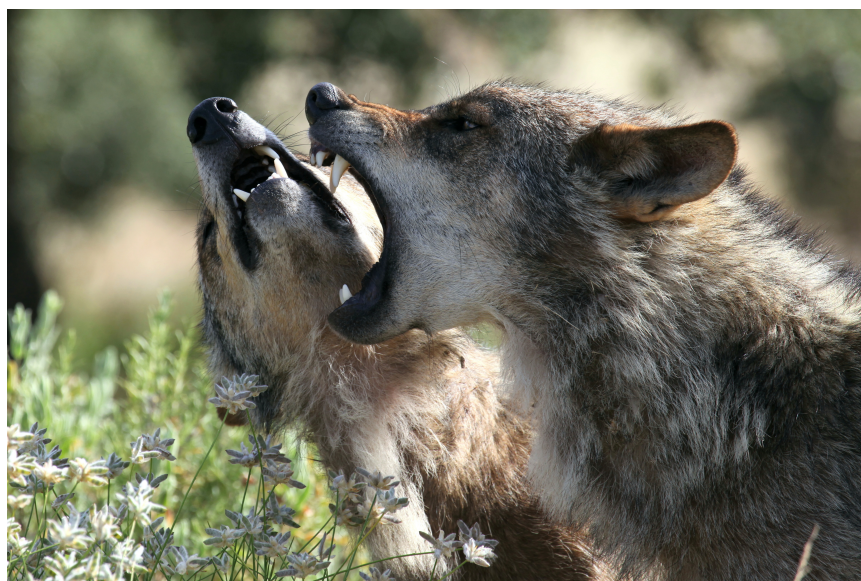
>> Components d'una mateixa llopada. Quan manifesten agressió o submissió, revelen qui serà el millor per exercir la jerarquia en el grup. Així es devien comportar els llops d'en Torrent. (Autoria: LLUÍS MORERA)

els llops no eren obra de Déu, sinó del dimoni. Malauradament, han hagut de passar moltes centúries per entendre el paper d'aquests carnívors en la cadena tròfica. Actualment, se sap que els conflictes amb els llops van començar a partir del neolític, quan els humans