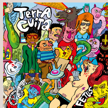
FETUS. Terra cuita . Bankrobber, 2019.