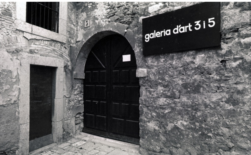
>> Galeria d'Art 3 i 5, que ha estat una de les principals experiències galerístiques del segle xx a Girona.

comarcals, museus, clubs nàutics, cafès, restaurants, hotels o entitats vàries. La manca de regulació del sector era la norma.