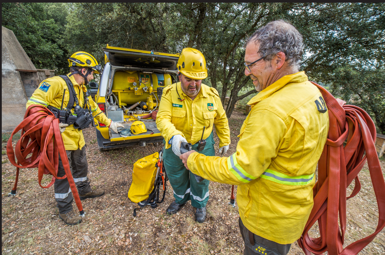
>> Recollida de les mànegues i de les eines de dins el bosc, que es dipositen tot seguit en una zona més adient.