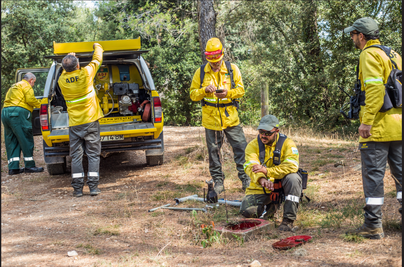
>> Moment de relaxació, sense deixar de complir amb les obligacions.