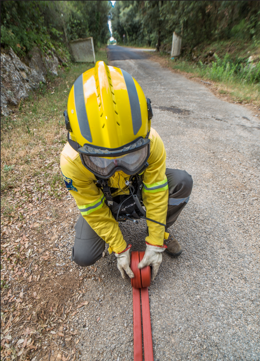
>> Plegat doble de la mànega utilitzada.