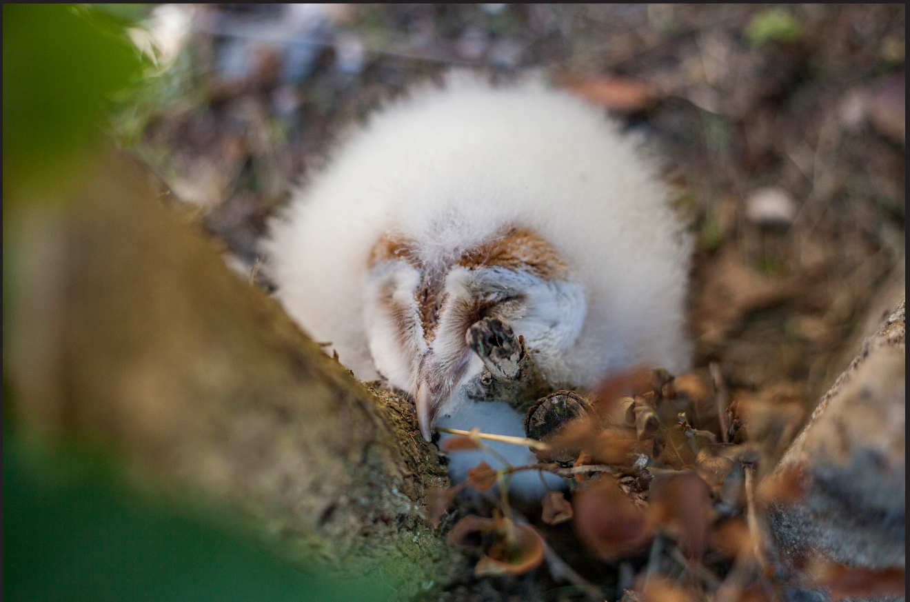
>> Poll d'òliba caigut del seu niu a Falgons, trobat per l'ADF i entregat als Agents Rurals.