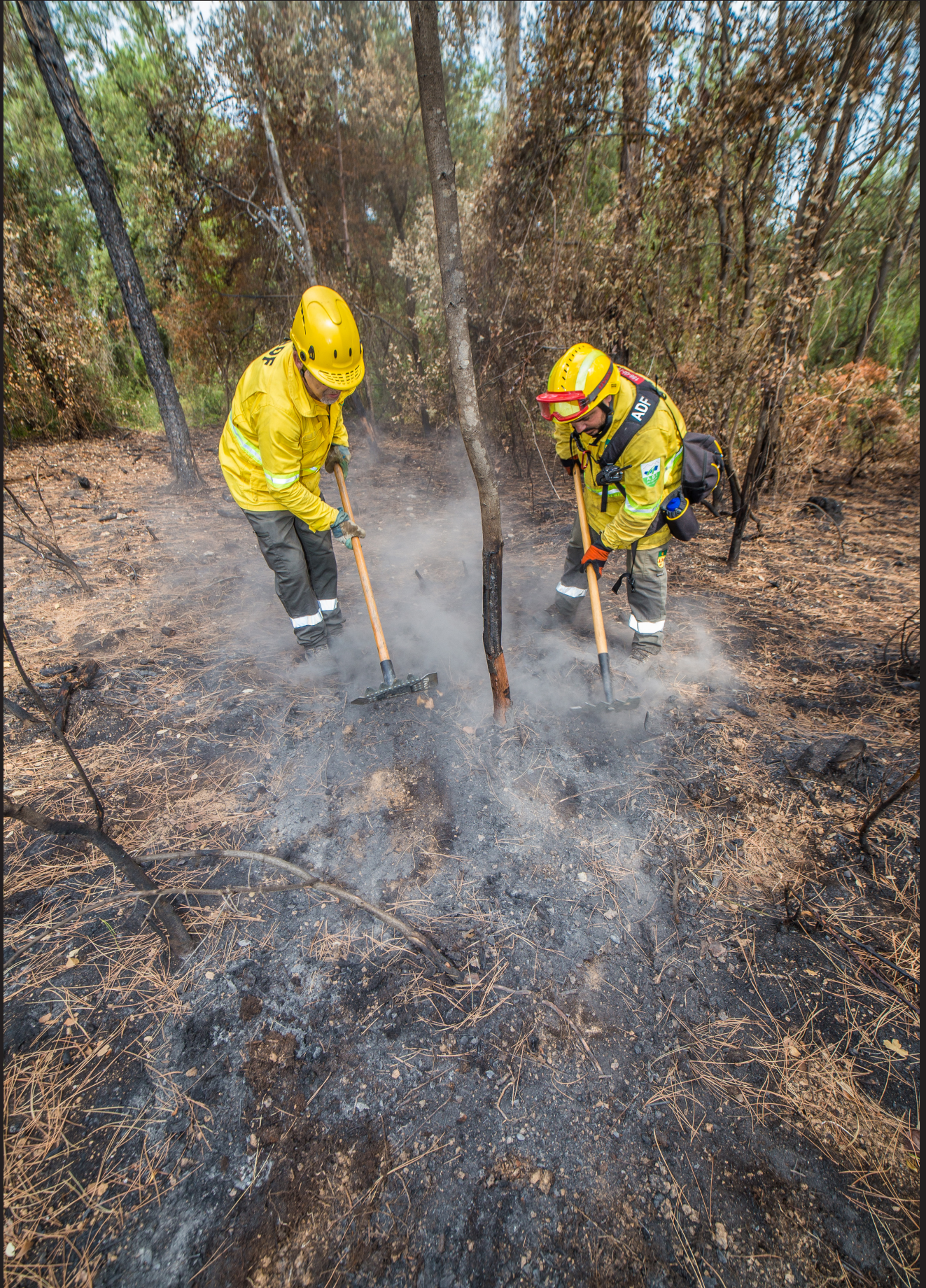
>> Recerca de possibles brases entre les cendres.