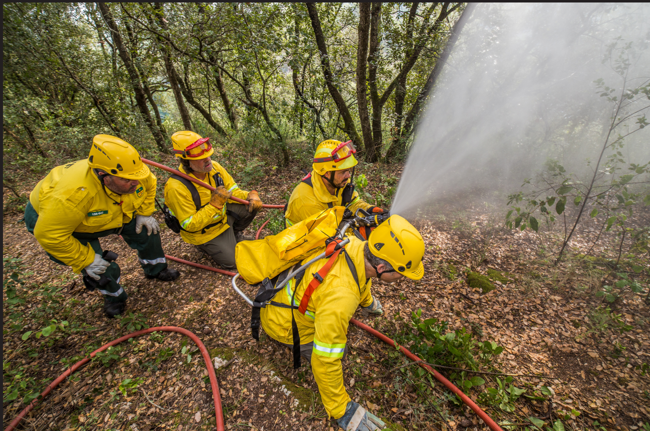
>> Realització d'una maniobra de protecció per ventall d'aigua.