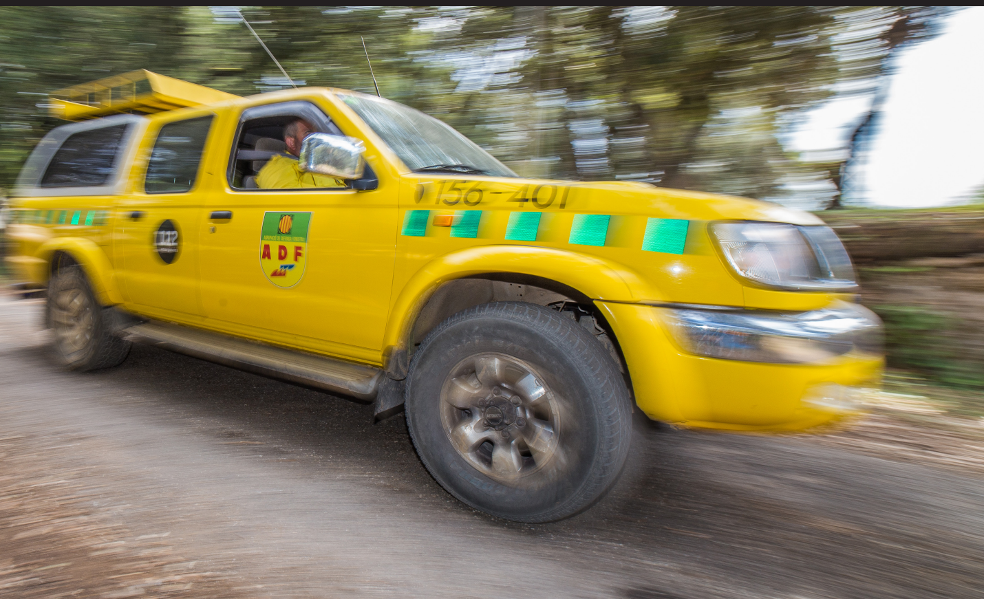
>> Els components de l'ADF de l'Estany, sortint amb els vehicles cap al petit incendi de Crespià, el passat divendres 5 de juliol.