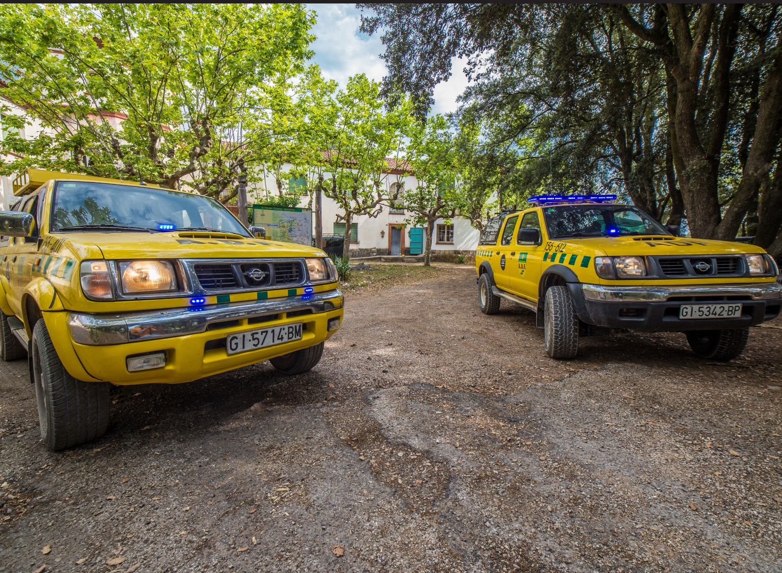
>> Revisió dels llums dels vehicles.

amics i companys, aprenguin a utilitzar eines manuals i siguin més valorades per la societat. Actualment ja està coberta la quota de persones amb discapacitat en aquesta Agrupació.