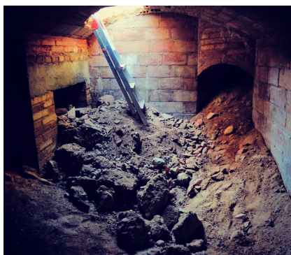
>> El refugi antiaeri de l'Estació de Figueres.