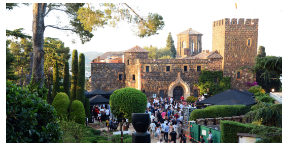
>> Els jardins i el castell de Cap Roig. (Autoria: PACO DALMAU)

per poder donar continuïtat al camí de ronda, els propietaris del castell i els jardins hi projecten ampliacions urbanístiques. La Fundació "la Caixa", que va aconseguir l'espai després de l'absorció de Caixa de Girona (entitat que el va rebre en herència el 1980), vol ampliar les instal·lacions amb dos edificis nous i un auditori semisoterrat. Els tràmits per part de les administracions implicades, sobretot la Generalitat, han anat sorprenentment rodats fins ara, és a dir, no hi ha hagut gairebé impediments al desenvolupament del projecte, perquè el consideren ajustat als requisits mediambientals i urbanístics. SOS Costa Brava no pensa igual i ha interposat un recurs contenciós al Tribunal Superior de Justícia de Catalunya. La polèmica està servida per a un projecte que, si més no, planteja dubtes sobre la seva necessitat. A banda del tema de preservació del territori, sempre present, potser fa falta reflexionar més sobre si cal modificar un espai que, per la seva història, sempre ha estat vist amb un cert aire de romanticisme, i que va ser concebut per convertir-lo en un oasi de pau.