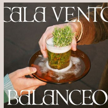
CALA VENTO. Balanceo . Montgrí, 2019. «calavento.com»

identificables amb un estil molt propi, però sense caure en reiteracions. Serenitat i rauxa juvenils els permeten crear peces de pop i rock vigorós i visceral, i anar acumulant experiència musical i vital. Probablement Balanceo sigui un disc lògic, en el sentit que representa l'evolució de qui comença de jove fent música per necessitat vital i assoleix un reconeixement creixent per part del públic, cosa que permet anar madurant la proposta musical i consolidar-la en les actuacions en directe. Musicalment el grup està més rodat i els temes els ha pogut treballar més, de manera que ha passat més hores a l'estudi d'enregistrament (a Motril, Barcelona i Sant Feliu de Guíxols). Tot plegat fa que les dotze cançons que s'apleguen en aquest disc puguin expressar tant serenitat com intensitat juvenil, reflexió i reivindicació. Dels inicis pausats d'«Un buen año», evoluciona cap a una guitarra afilada, en la