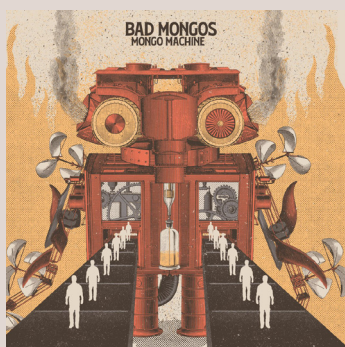
BAD MONGOS. Mongol Machine . Bcore, 2019. «www.facebook.com/badmongos»