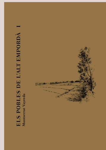
VAYREDA, Montserrat. Els pobles de l'Alt Empordà . Bellcaire d'Empordà: Edicions Vitel·la, 2018. 2 vol. 1.285 p.

El més destacable és el retrat fidedigne que es fa de la postguerra en pobles com Santa Pau, així com de la vida a pagès, que l'autor descriu amb dolça melangia i enyor i que, per cert, coincideix amb narracions gairebé calcades de petits pobles de la Selva interior. La novel·la aconsegueix, doncs, una barreja equilibrada de misteri, història i tendresa que no deixarà indiferent: una novel·la costumista d'avantguarda.