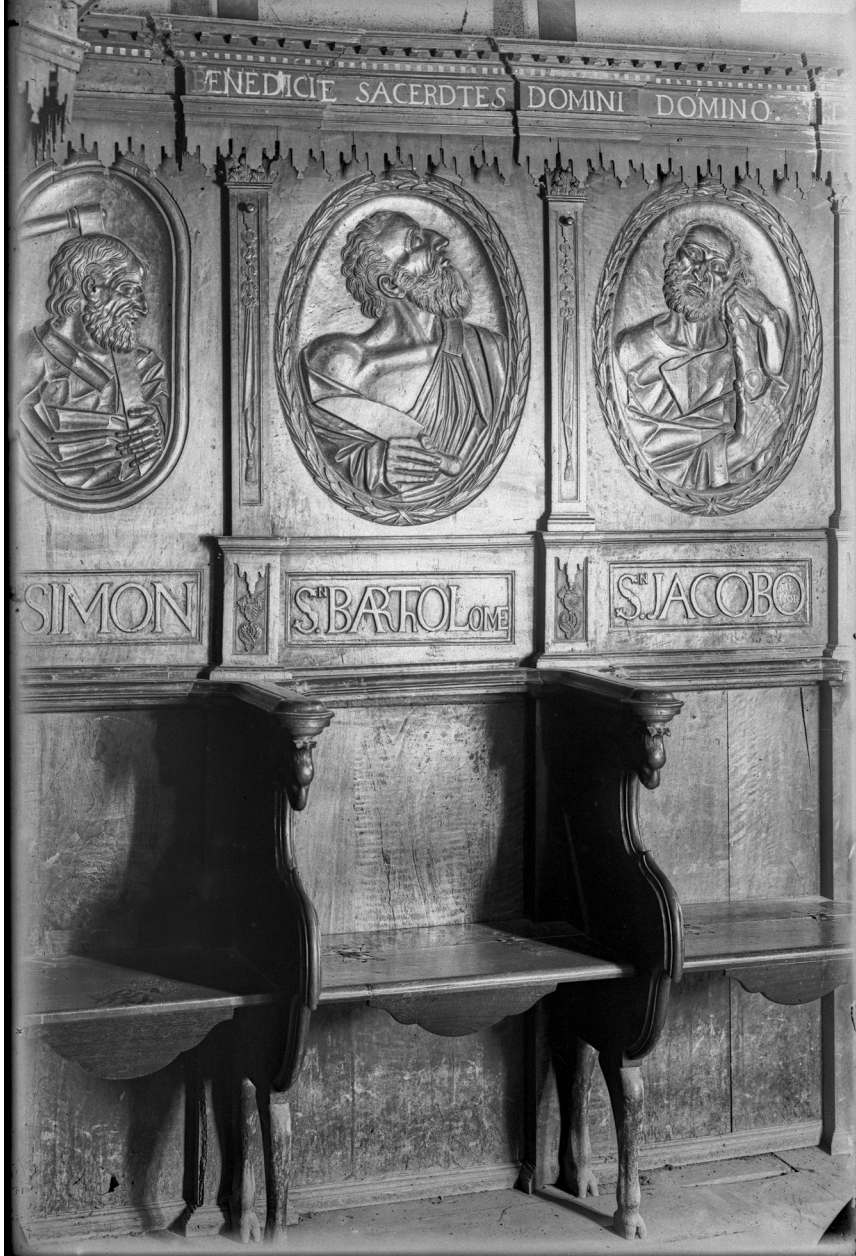
>> Cadiral del cor de l'església de Sant Miquel, a Valljunquera, amb les figures de sant Simó, sant Bartomeu i sant Jacob. Terol. 1919.

que anari sol per no trovar cap animal, y un home solament per acompanyarme volia 5 pessetes, y vaig fero sol per aquelles montanyas entre anar y tornar 5 hores caminant ab un sol canicular que ho cremava tot, y total 3 plaques». El fotògraf afegia: «Vaig quedar inutil per un dia».