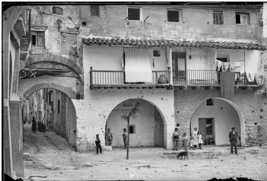
>> Portal i voltes de la plaça Major d'Híjar. Terol. 1919.