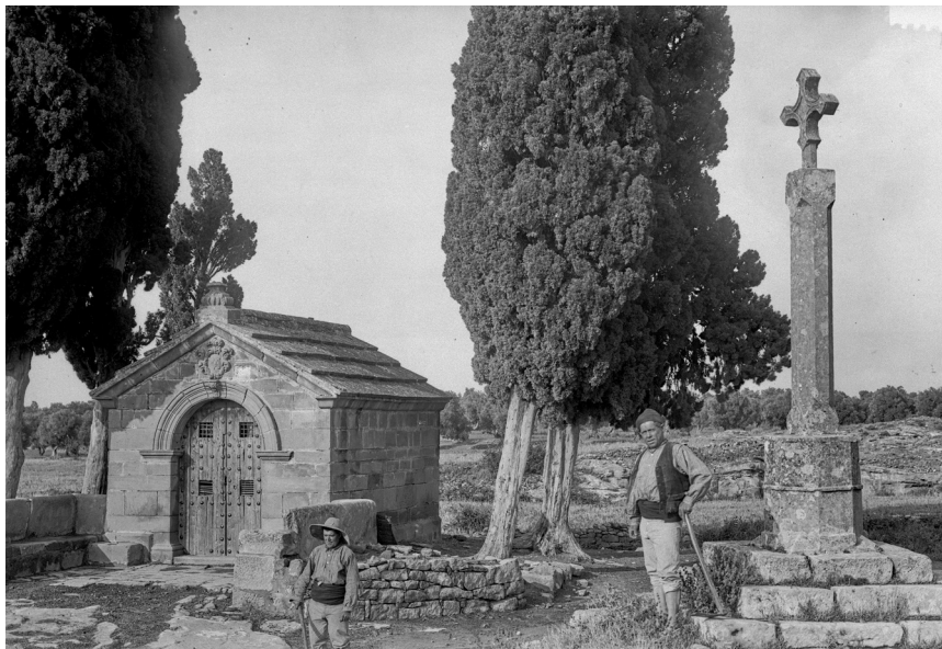
>> Retrat de dos homes a l'esplanada de la capella i la creu de la Misericòrdia, a Calaceit. Terol. 1919.