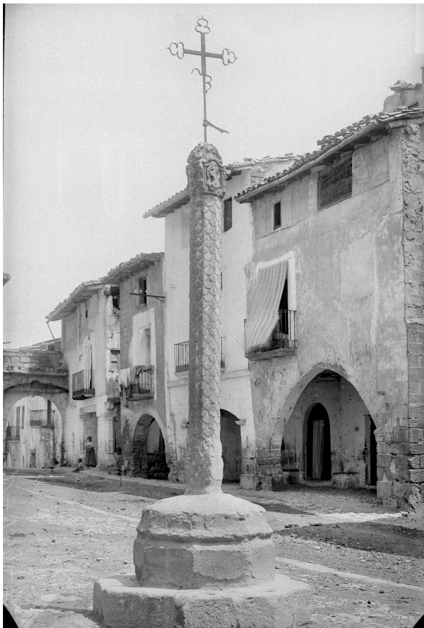
>> Creu de la plaça de la Constitució, a la Freixneda. Terol. 1919.

Fargnoli era del parer que per viure en aquell país «si te de estar acostumat els habitants son molt bruts per la part del menjar y dormir», i com a