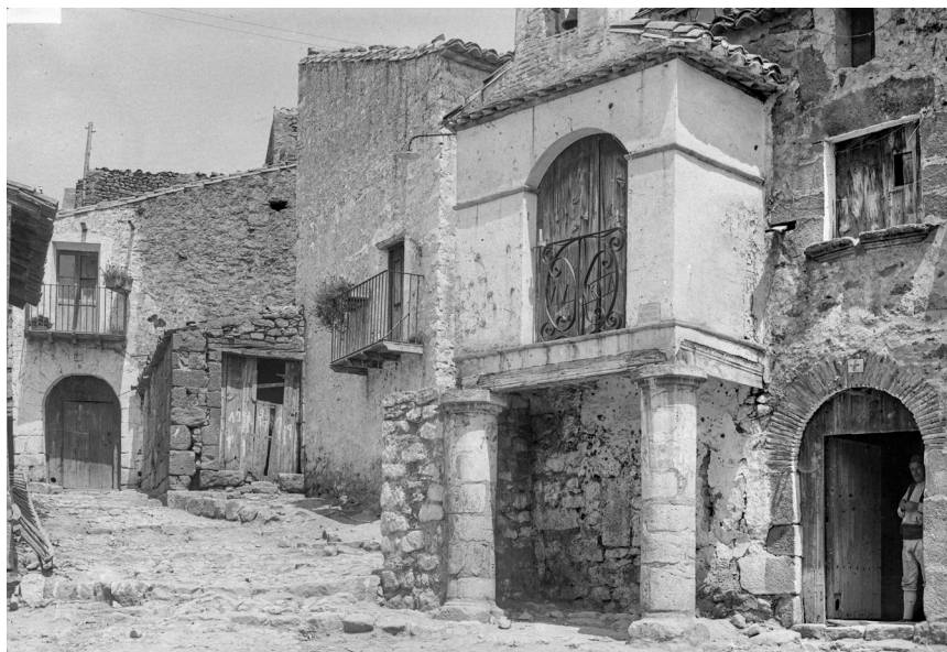
>> Capella de la Mare de Déu del Carme, a la plaça del Carme. Cretes. Terol. 1919.

>> Pintures murals d'estil gòtic del segle XIV, amb temes joglarescos i cavallerescos, a la torre de l'Homenatge del castell de Calatrava, a Alcanyís. Terol. 1919.