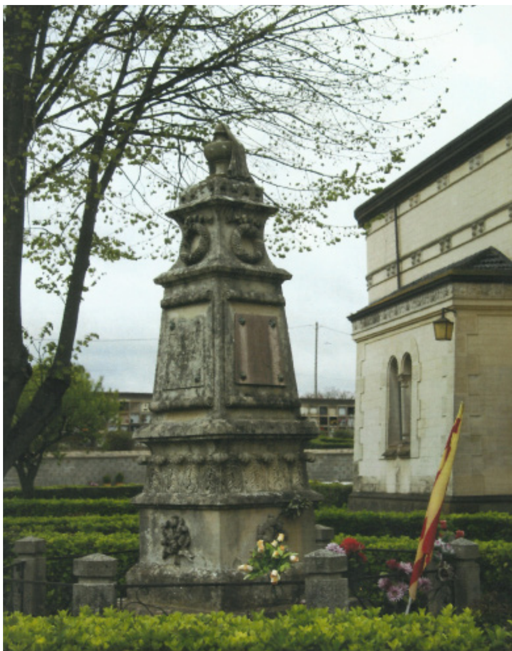
>> Monòlit dissenyat per l'escultor Ramon Casal, dedicat a les víctimes de la Bisbal. 1888. (Autoria: ÀNGEL JIMÉNEZ)

Les conseqüències van ser greus. Era el fracàs i el descrèdit d'un partit polític incapaç d'imposar el seu projecte. I seria un factor decisiu en l'encaminament del moviment obrer cap a l'absentacionisme polític i l'anarquisme, en constatar que l'Estat donava l'esquena a les reivindicacions bàsiques dels treballadors. La revolució social es fa des de baix, dirien els sindicalistes empordanesos.