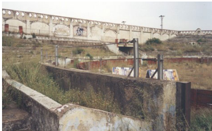
>> La plaça de toros de Figueres, que presenta un estat lamentable.

La plaça de toros | L'única plaça de toros que hi ha a l'Alt Empordà va ser construïda per Pau Gelart el 1886 al costat de l'estació de ferrocarril de Figueres (el tren hi havia arribat el 1877) i hi cabien cinc-centes persones. Ampliada i inaugurada el 1894, ara fa 125 anys, ja tenia capacitat per a cinc mil aficionats. Anava tirant i fa mig segle va tenir una revifalla amb el turisme. Després, el desinterès per les corrides la va sumir en la decadència, i el 1989 el consistori de Marià Lorca va adquirir la plaça de toros al darrer Gelart per 120 milions de pessetes. Durant aquests darrers trenta anys no s'hi ha fet res, llevat de deixar-la degradar; hi han crescut herba, arbusts i arbres arreu, i la brutícia se n'ha ensenyorit. L'Ajuntament l'ha més o menys usat de magatzem de ferralla, de vehicles esventrats, etc. A cada campanya electoral se'n parla una mica, i es fan propostes que el contribuent rep amb sarcasme o indiferència. Les darreres es concretaven en la conservació dels elements més pintorescos (el perímetre octogonal, il·lustrat amb arcs de ferradura i merlets al capdamunt) i l'enderroc de la resta per fer-ne un pàrquing pacificador , com el del camp de futbol vell, situat al costat.