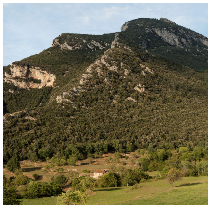
>> El Bassegoda des de Can Gustí de Riu. (Autoria: QUIM ROCA)

Uns apunts, solts, de la comarca | Enguany, a les Planes d'Hostoles, han celebrat els cent anys dels homenatges a la vellesa. També s'han commemorat els cent anys de l'Escola Municipal de Música d'Olot, una data rodona que sempre és digna de celebrar. Fa cinquanta anys que es van unificar els cinc ajuntaments que formen l'actual Vall d'en Bas, on es va fer la primera concentració agrària de Catalunya, la qual cosa va comportar la racionalització de les terres, que es van agrupar a l'entorn de les cases per acabar amb el minifundisme que hi havia fins aleshores. És bo recordar que finalment Sant Aniol d'Aguja té llum elèctrica, provinent de plaques solars instal·lades al teulat del refugi. A l'abril, l'Associació Catalana de Crítics d'Art (ACCA) va reconèixer amb un premi ACCA la tasca de l'Associació Cultural Binari, organitzadora, conjuntament amb l'Ajuntament de Bianya, d'uns recorreguts per la Vall de Bianya que segueixen un itinerari d'art contemporani i alhora permeten visitar part del seu ric patrimoni arquitectònic en un entorn paisatgístic de primer ordre. Al maig, a Maià de Montcal va tenir lloc la segona Fira de l'Ou, un esdeveniment que mou tot el poble, amb activitats destinades a tots els públics.