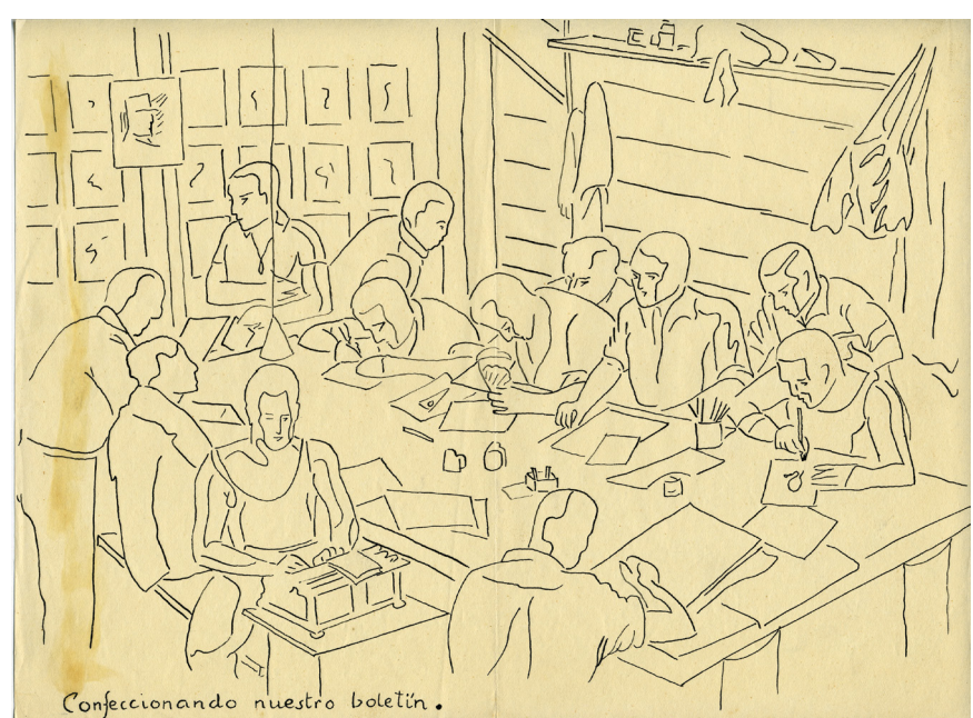
Confecionando nuestro boletín.