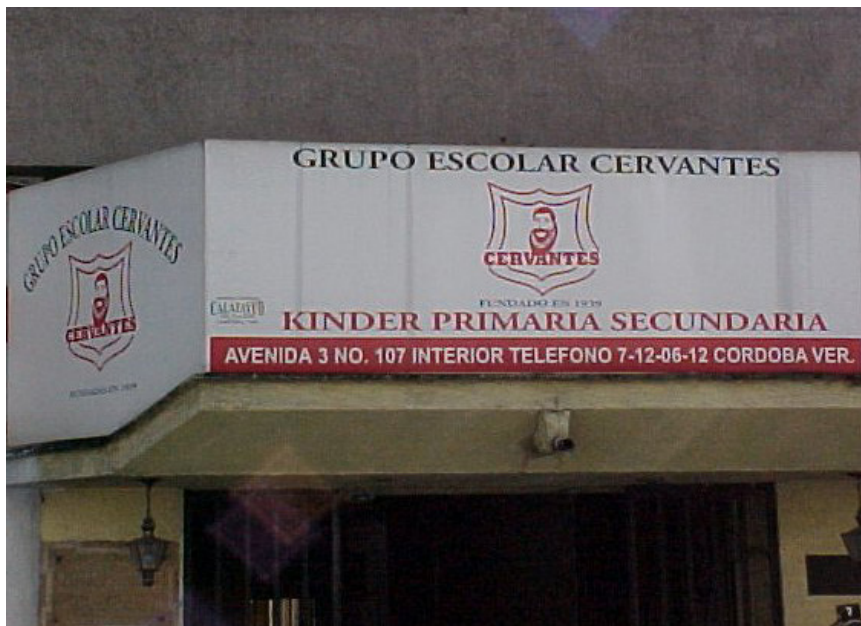
>> El Colegio Cervantes de Córdoba (de la família Bargés).