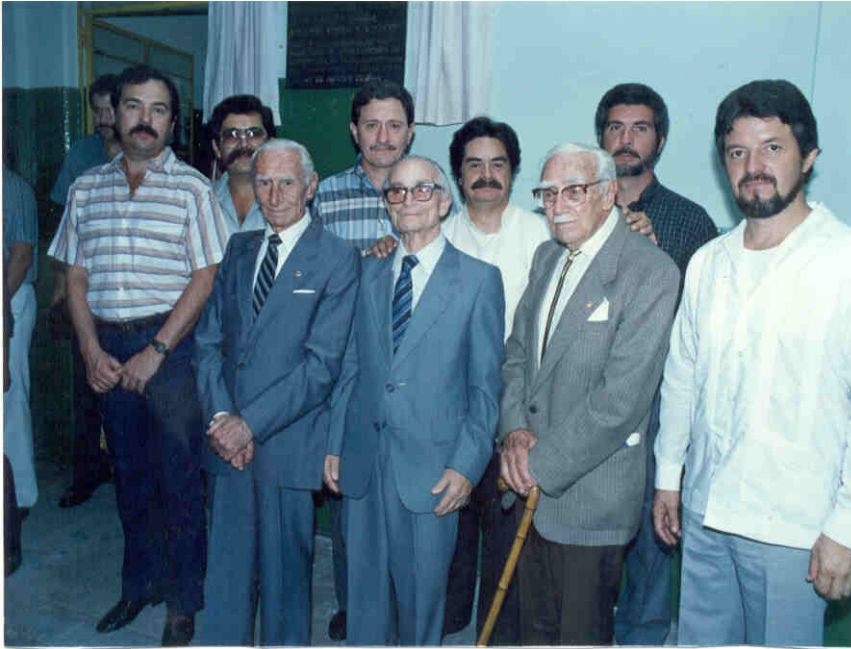
>> Els mestres que feien classe al camp de Sant Cebrià.