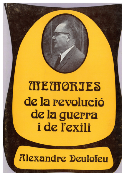
>> Memòries de la revolució, de la guerra i de l'exili, d'Alexandre Deulofeu, primer document autobiogràfic publicat d'un exiliat gironí.

>> El quadern amb el manuscrit original del text memorial de Josep Irla (1956), dedicat als «amics del districte de la Bisbal».