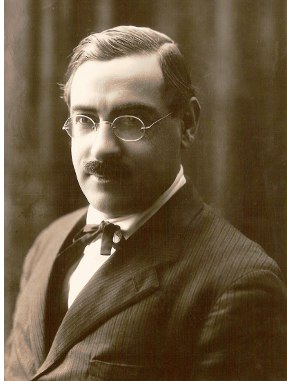
>> Antoni Rovira i Virgili.