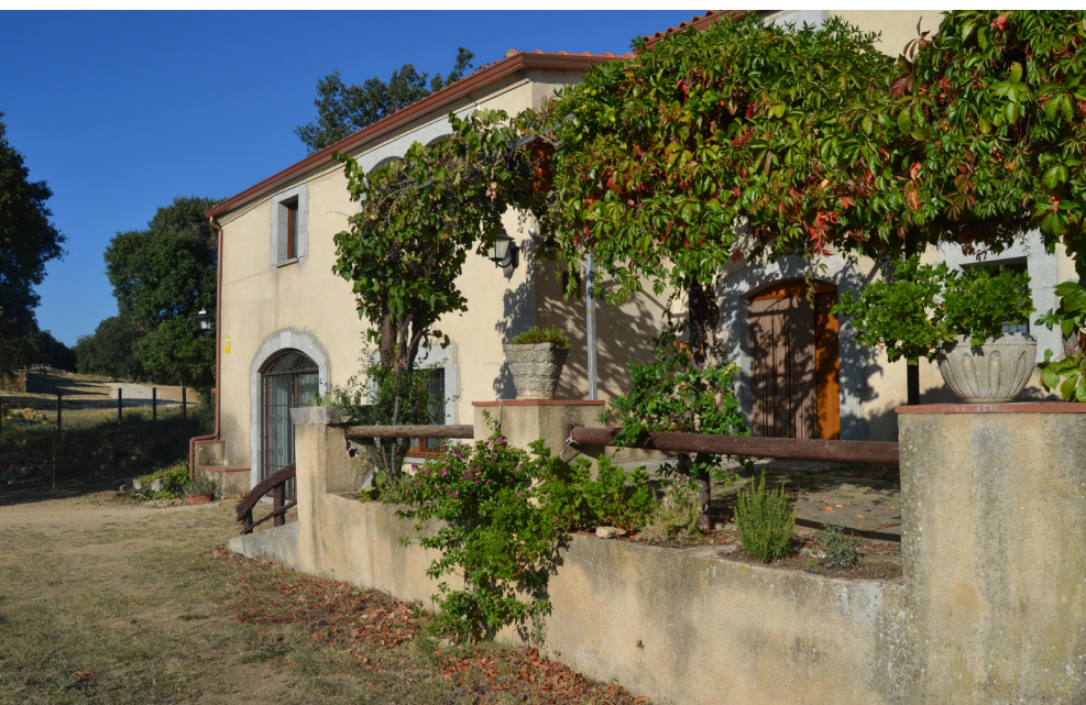
>> La casa de can Jaques, al costat de l'església de Santa Maria de Montnegre, destruïda pel foc del 1928.

mas de Casagran i el porxo del mas Sàbat, que eren de la seva propietat, entre altres construccions del massís.