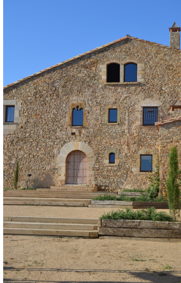
>> El mas Oms, que tot i que no va ser destruït pel foc, sí que en va resultar afectat.

Aquells fets no sols inspiraren literàriament Ruyra, sinó que l'impul-