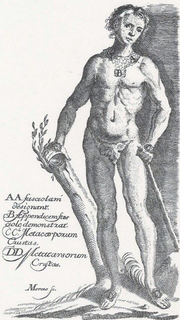
Il·lustració del llibre del Dr. Gaspar Casal relativa al "Mal de la Rosa".

>> Gravats del llibre Historia Natural y Médica del Principado de Asturias , que és el compendi de tots els estudis que va fer Gaspar Casal.