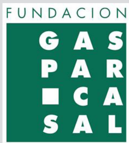
>> Logotip de la Fundació Gaspar Casal.

»Varen haver de passar molts anys, i que sorgís la doctrina meravellosa de les vitamines, perquè es valoressin, en la seva justa mesura, les descobertes del doctor Casal. Avui tots els llibres sobre vitamines que es publiquen arreu porten el seu nom estampat a la primera pàgina, atorgant-li la categoria insigne de qui fou profeta de moltes coses que ens ha ensenyat la ciència actual».