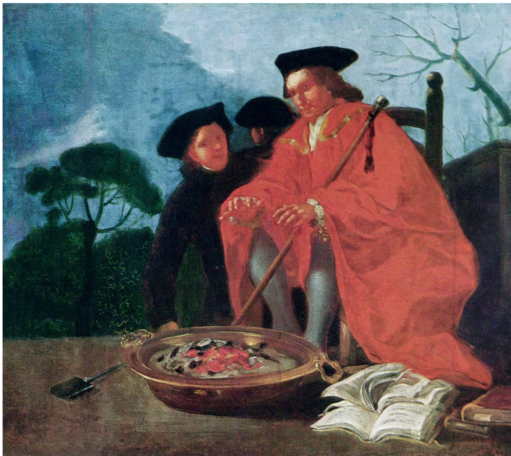
>> Quadre El médico, de Francisco de Goya, amb la figura que tradicionalment s'ha identificat amb Gaspar Casal.