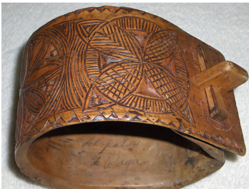
>> Collar d'ovella de la Cerdanya del segle XIX. És musicat, la qual cosa significa que el pastor l'havia treballat molt en l'ornamentació de figures d'origen ben primitiu.