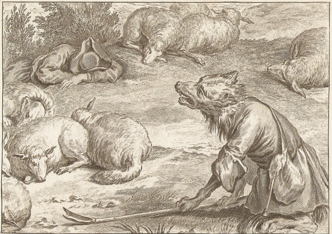
Le Loup devenu berger!

>> Il·lustració de la faula «El llop que volia ser pastor», de La Fontaine, en un gravat a la fusta del segle XVIII.