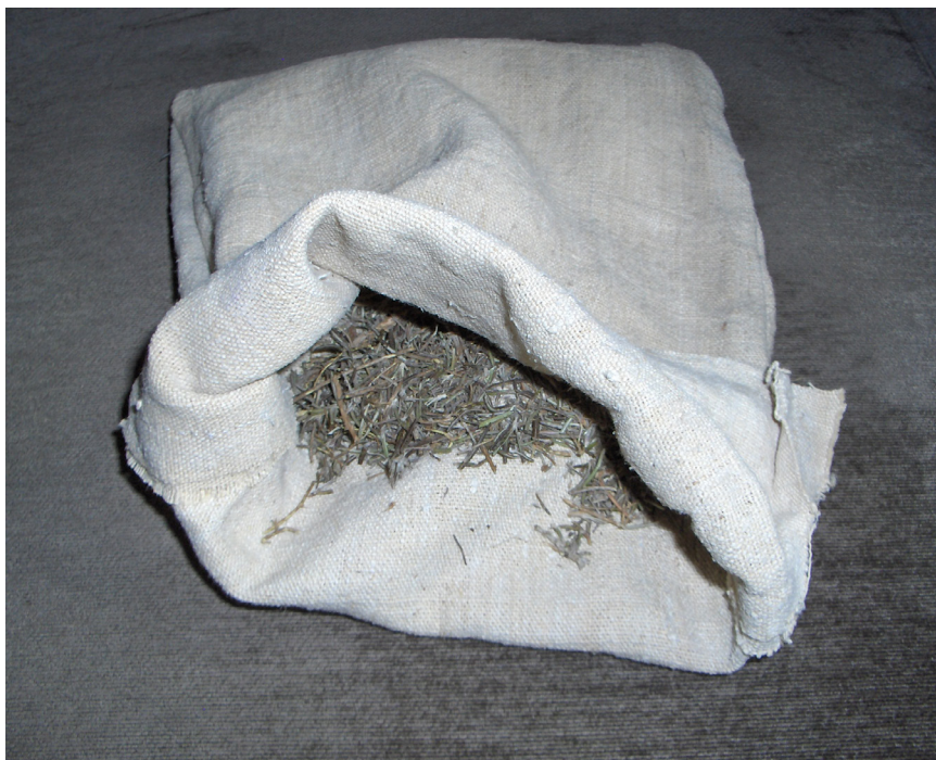
>> Un sac amb plantes aromàtiques, que després de ser esmicolades i beneïdes eren utilitzades per alguns pastors als llocs on orinava el llop.

mal, l'engany i la dolenteria. Són proses que recuperen costums de l'època, que inclouen superstició i fetitxisme, on la intenció moralitzadora s'esvaeix, encara que trobem alguna línia que mostra la natura pietosa del llop davant un home prostrat i abatut: «Allò no era pas somni, era pura realitat. Un lloparràs, creient-me mort de cos com ho era d'ànima, havia vingut a donar-me sa besada, l'òscul del fosser» ( La puyalada , 1904, cap. XIX).