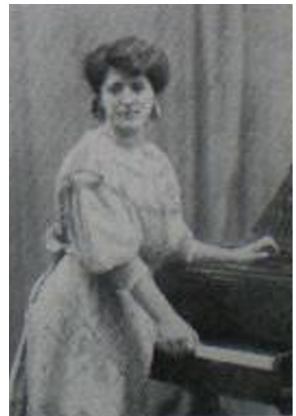
>> La pianista, cap al 1910.

Conservatori li va concedir post mortem la seva màxima distinció. Va morir a la seva residència de Miraflores el 26 de juliol de 1972, a l'edat de 80 anys. Serveixin aquestes línies d'homenatge i record a aquesta il·lustre gironina.