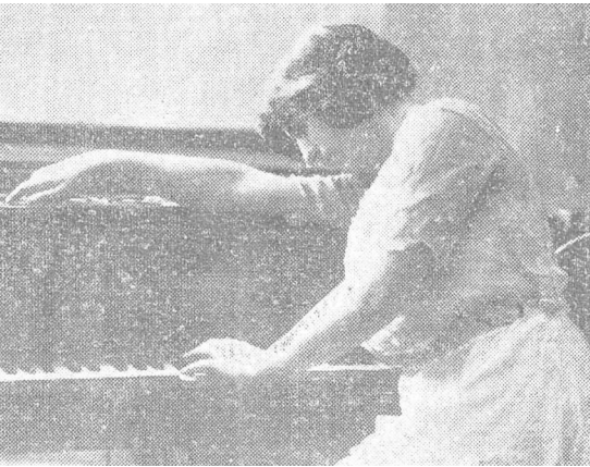
>> La pianista, l'any 1917.