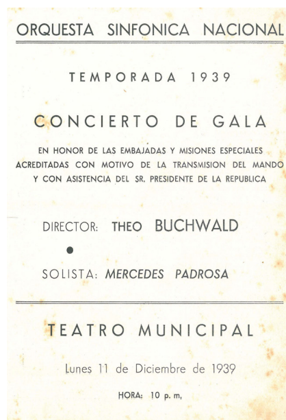
>> Programa d'un concert ofert el desembre del 1939 a San Juan de Puerto Rico.