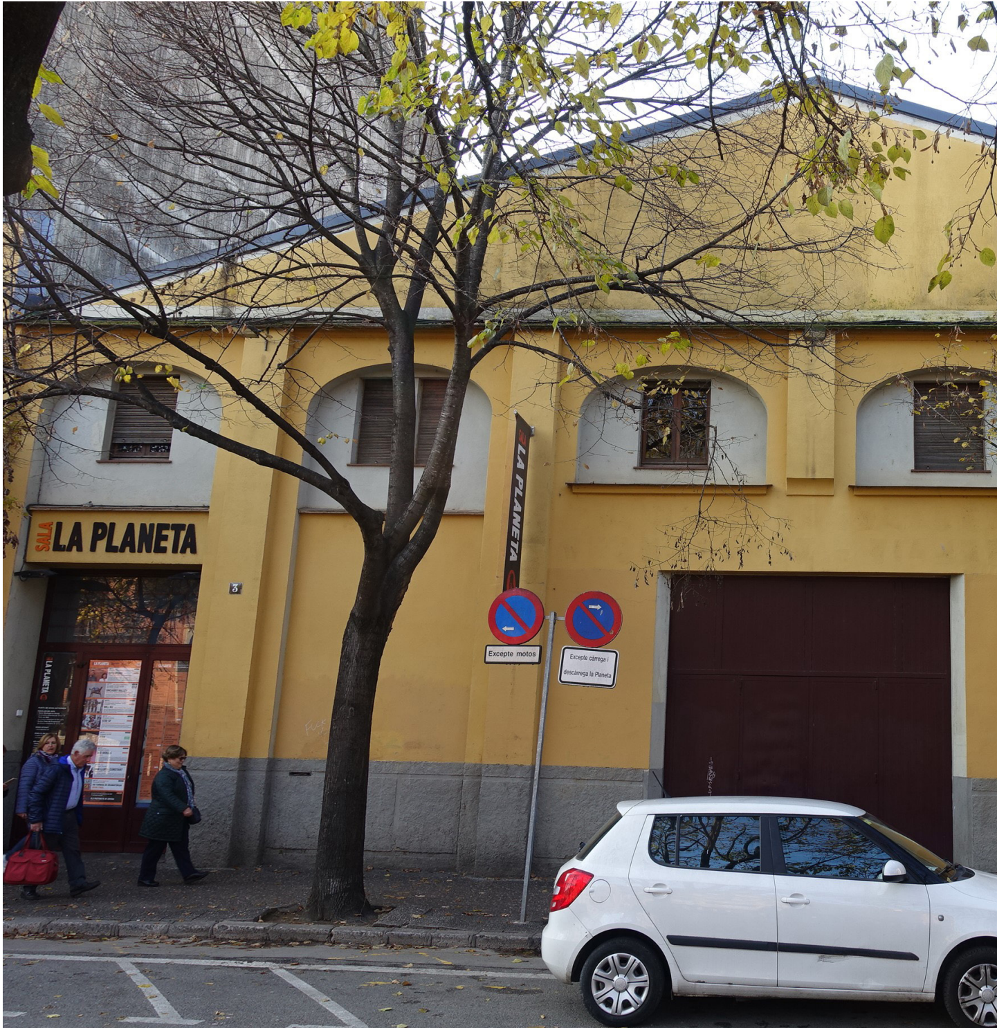
>> Estat actual de la façana del passeig Canalejas. L'adequació de l'edifici per contenir la Sala La Planeta va recuperar parcialment l'aspecte i ús originals: l'espectacle i l'entreteniment. (Autoria: LAIA DE QUINTANA)

amb dues portes als mòduls centrals. La del carrer Fontclara té en el centre tres mòduls de les mateixes dimensions i dos mòduls més estrets, en una proporció de 3:2, als extrems, on hi ha situades les portes. Finalment, el xamfrà dibuixa dos mòduls lleugerament més grans i no proporcionats. Visualment, des del riu, l'edifici té la forma