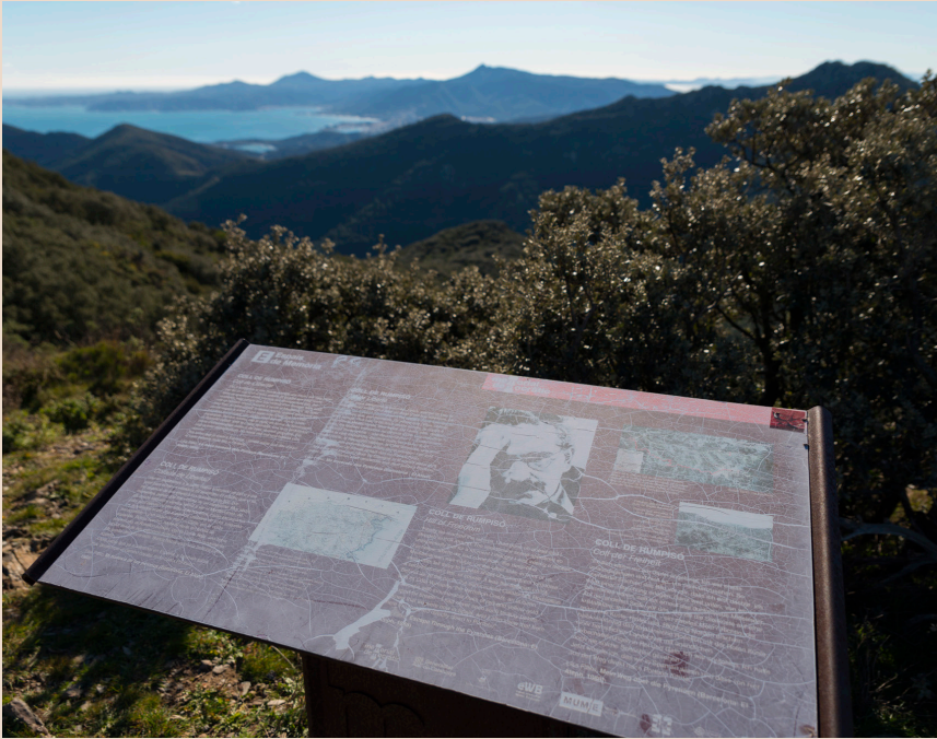
>> En arribar al cim, veiem Espanya i el mar de nou.