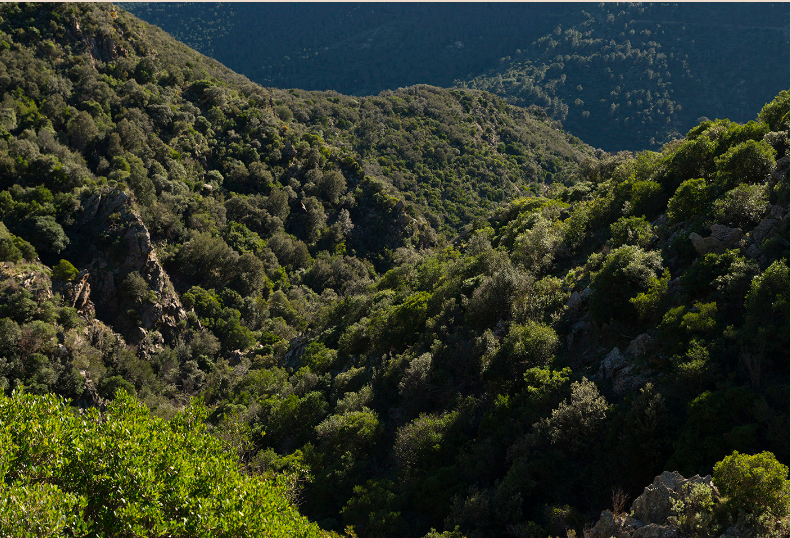
>> A poc a poc albirem l'estació, el lloc on comencen uns recorreguts i finalitzen uns altres.