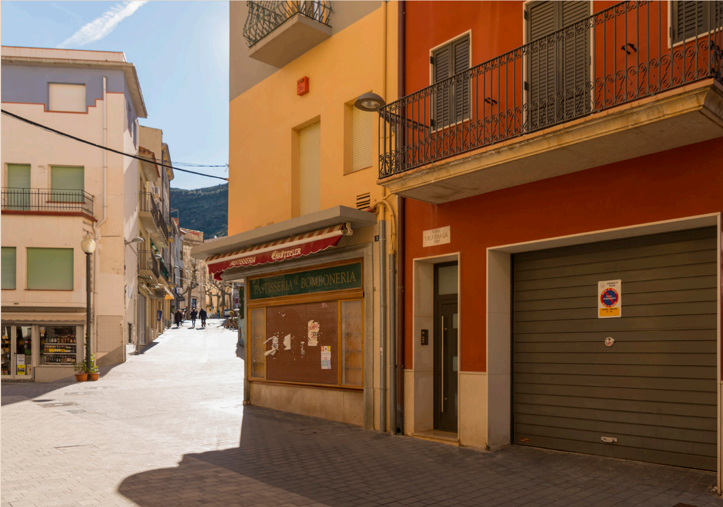
>> Ens endinsem al carrer del Mar i hi trobem l'hotel.