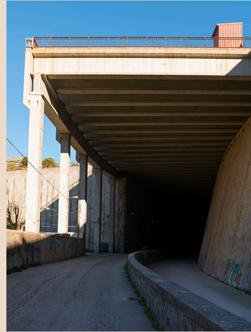
>> Entre les vies del tren i el poble.