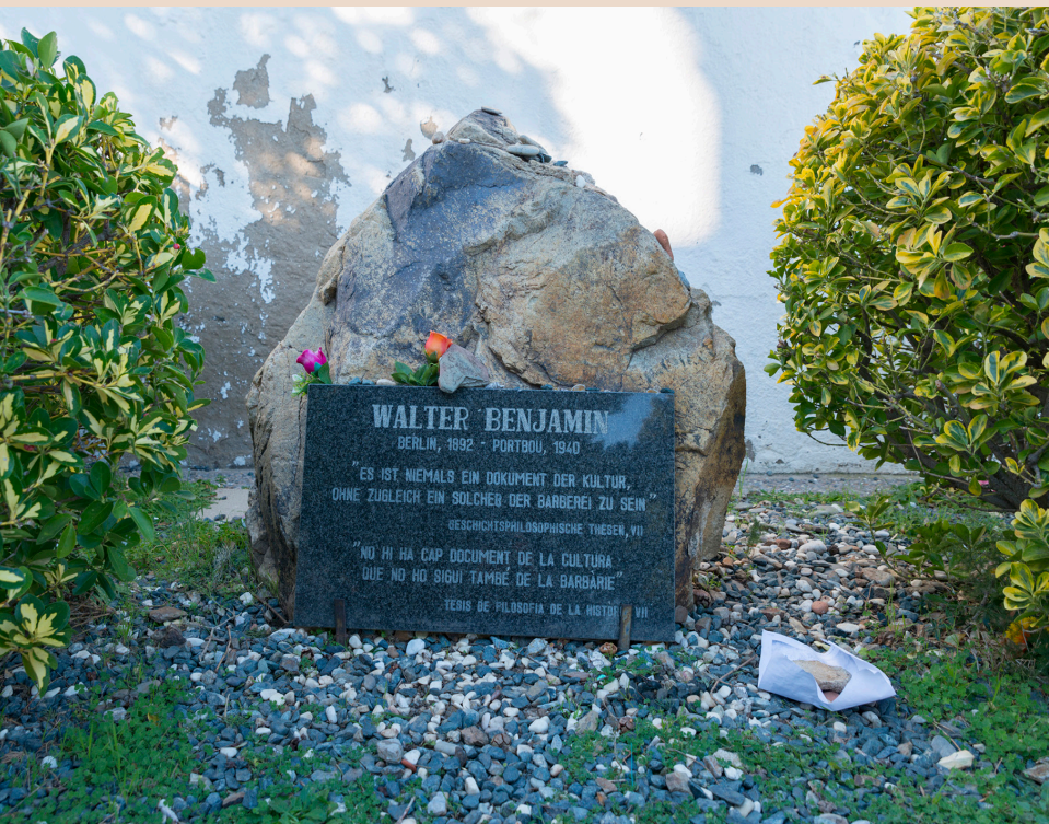
>> La làpida de Walter Benjamin al cementiri de Portbou.