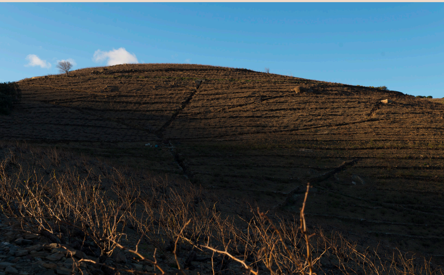
>> La vinya, el meravellós símbol del plaer negat.