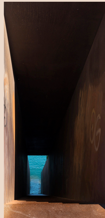
>> Al final de l'escala, el memorial de Dani Karavan trenca violentament el mar.