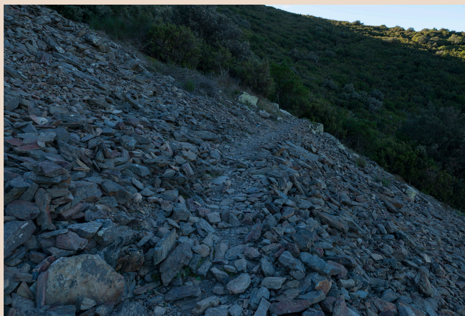
>> Indrets en què els rocs guanyen la partida a la vegetació.