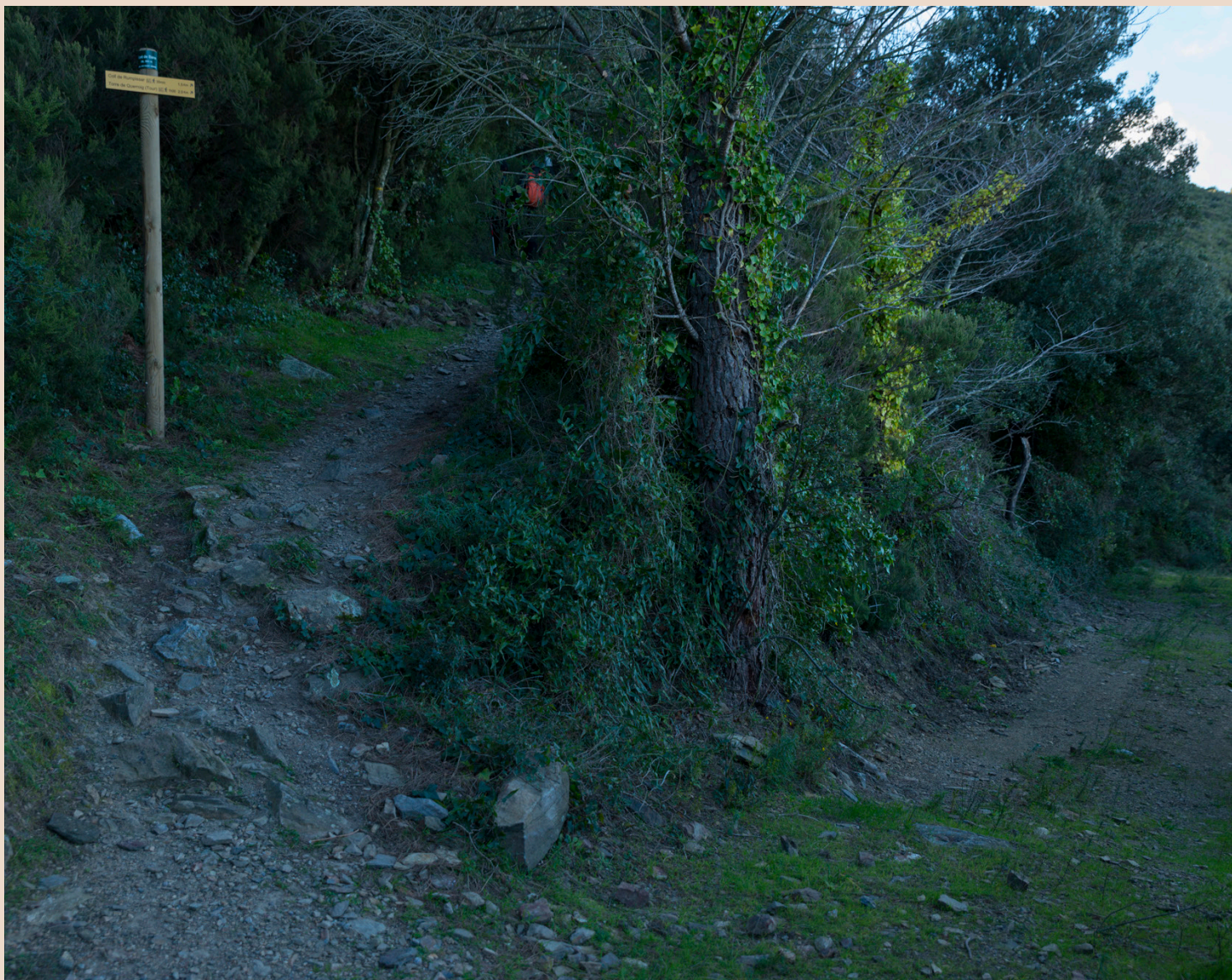
>> Una de les cruïlles per on va passar el filòsof.