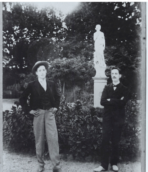
>> Rahola amb Xavier Montsalvatge a la Devesa a principis del segle xx.