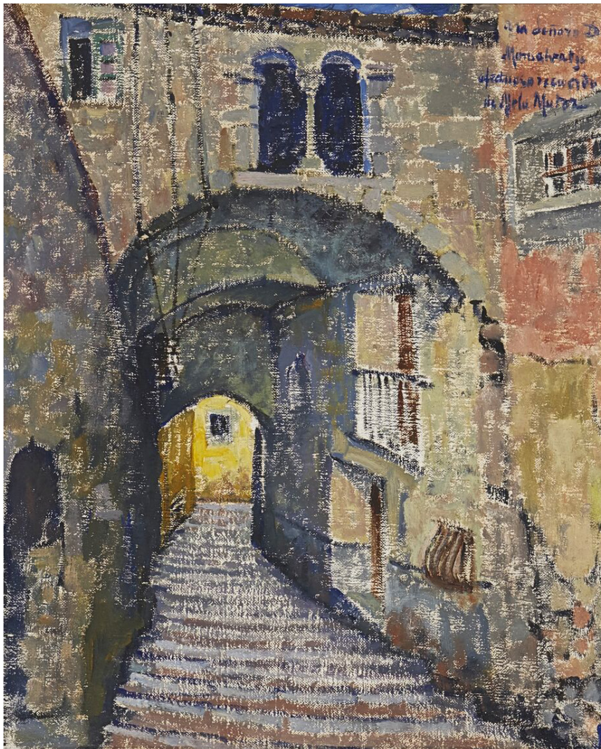
>> Carrer Cúndaro, Girona [Racó típic]. 1914. Oli sobre tela. (Font: AJUNTAMENT DE GIRONA, MUSEU D'HISTÒRIA DE GIRONA. DONACIÓ DE LA FAMÍLIA MONSALVATJE.)

ber captar, a través del pinzell i sobre la tela, una ciutat potser mig endormiscada però, al mateix temps, que batejava delerosa. Això defensava el desaparegut Narcís-Jordi Aragó a la conferència «La mirada nova d'una polonesa», impartida a principis dels noranta al Museu d'Art de Girona. En el moment, el maig de 1914, l'arquitecte Rafael Masó agràia l'esguard de Muter a l'article «D'Athenea. Lloes a l'obra de Mela Mutermilch», publicat al Diario de Gerona : «Cantin els demés l'anècdota i se esforcin en fer sobre la tela més melangiosa i grisa la nostra ciutat amada; Vos, en l'entre tant, oh dona forta de la heroica Polònia, ens en dieu les joies calmes i les platituts daurades».