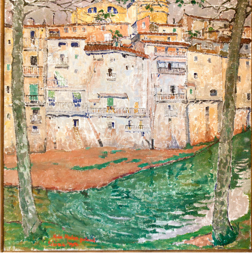
>> L'Onyar a Girona [Vora el riu]. 1914. Oli sobre tela. (Font: MUSEU D'ART DE GIRONA)