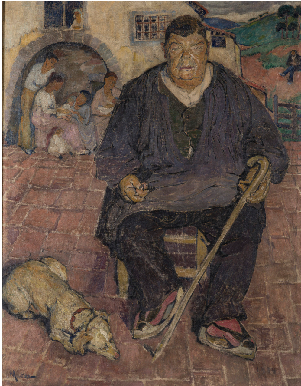
>> Català [En Catalogne]. 1914. Oli sobre tela.