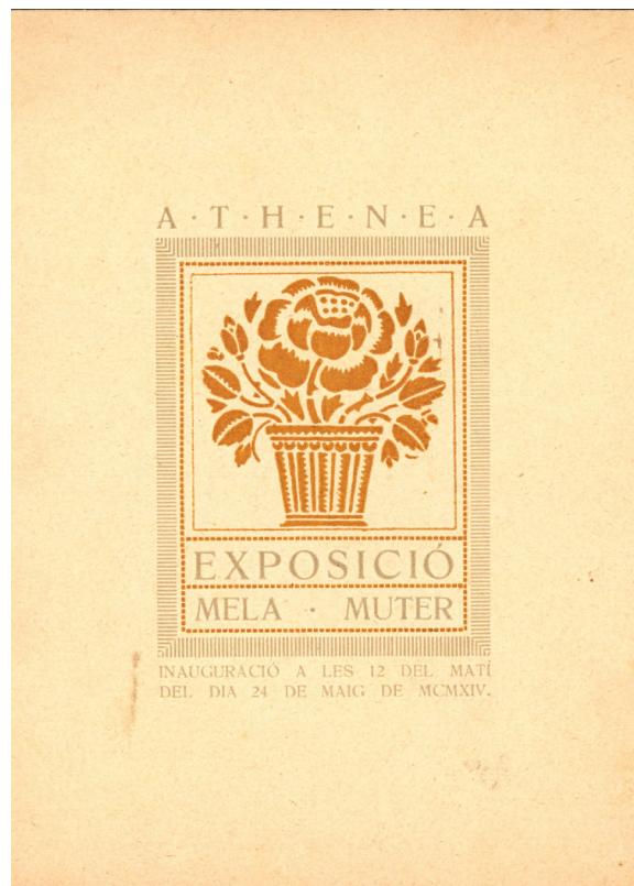
>> Portada del catàleg de l'exposició de Mela Mutter a la sala Athenea. Girona, 1914.