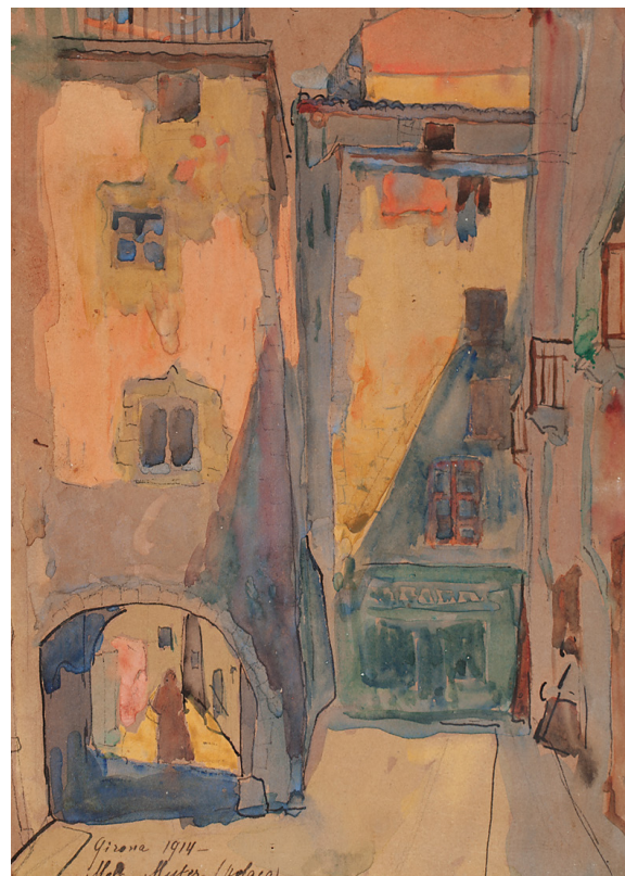
>> Carrer de les Ferreries Velles. Girona, 1914. Aquarel·la.

A Souvenirs , Mutter parla de l'ambient ensopit que es respirava a Girona i que es correspon amb l'imaginari d'una ciutat grisa i provinciana: «La ciutat conté molts edificis nobles, torres velles, esglésies i un gran seminari els alumnes del qual, molt nombrosos, vesteixen sotana negra i uns barrets esfilagarsats, també negres [...] Només es veia això: una multitud de punts negres esquitxant els murs grisos». Tanmateix, també guardava un record alegre del mercat, on hi havia de tot «instal·lat sota l'incomparable sol meridional». I és que l'artista va sa-