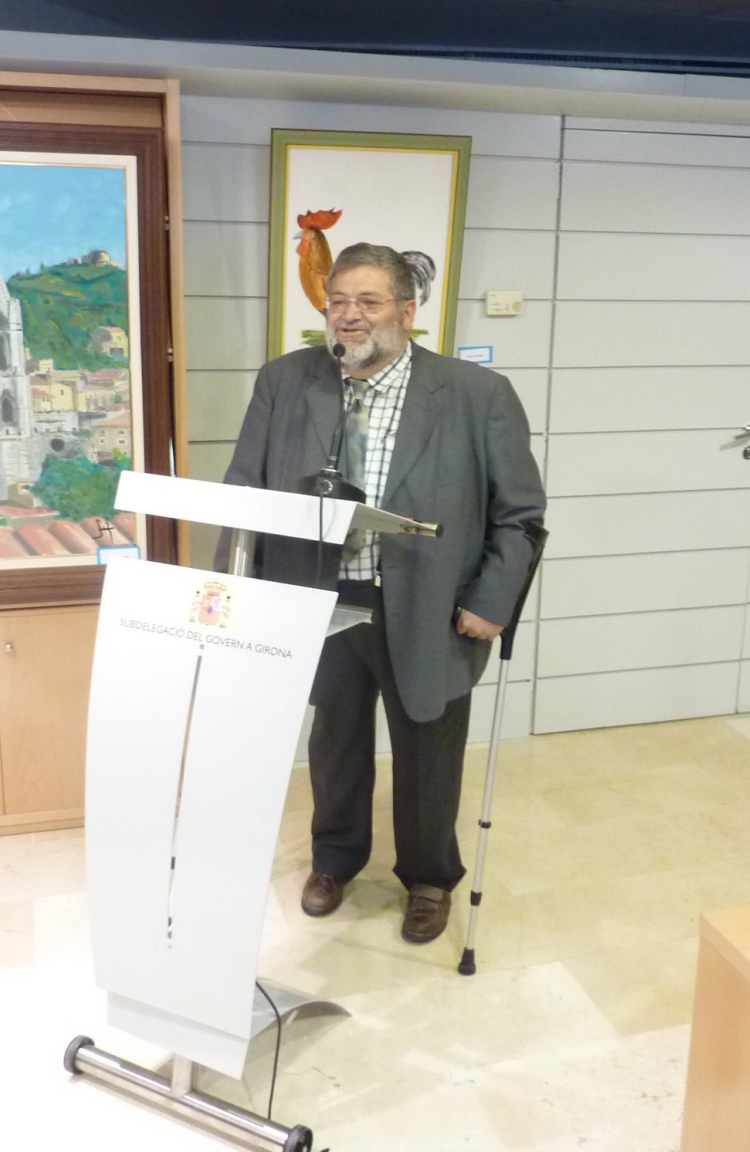
>> Tubert, el 2012, durant la presentació del concurs d'art de MIFAS, a l'antiga llibreria de la Generalitat.