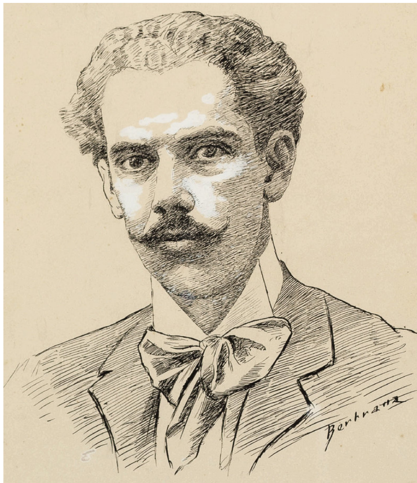
>> Autoretrat de Prudenci Bertrana.

Amb l'experiència del 6 d'octubre i veient que els ànims estaven molt exal-