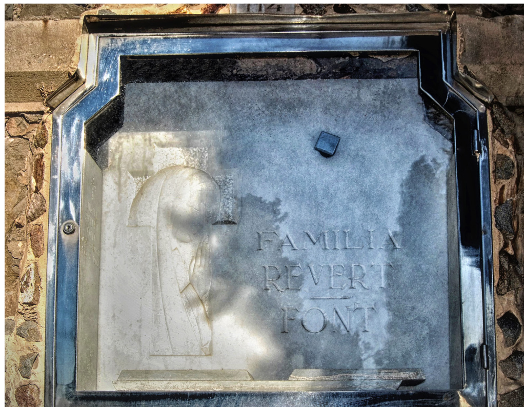
>> Sepultura de Vicente Carreras al cementiri de Montjuïc.