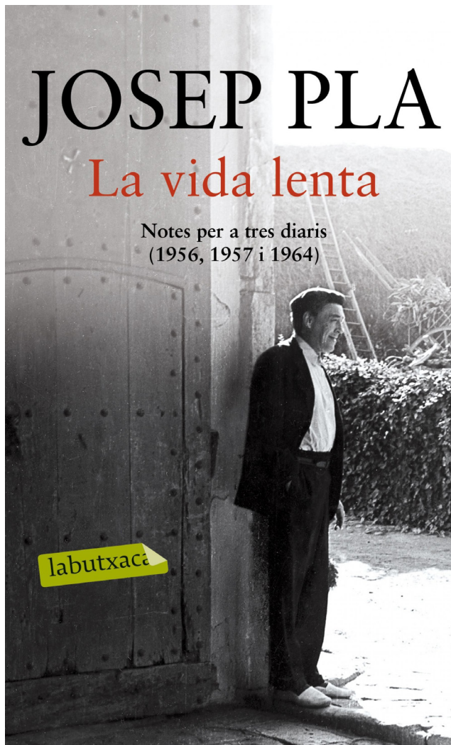
>> Portada de La vida lenta.