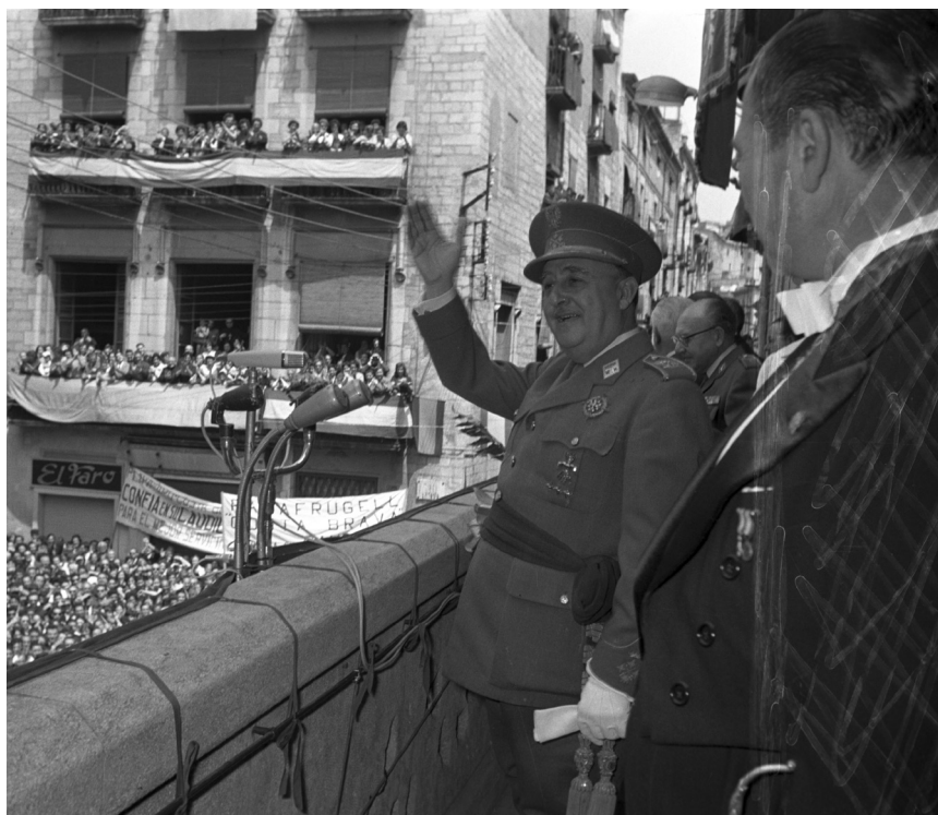
>> Franco saludant des del balcó de l'Ajuntament de Girona en la seva visita del maig del 1960.

L'opinió que li mereixia l'Estat espanyol de l'època, a causa de la seva contundència, va arribar a ser utilitzada per promocionar comercialment el llibre: «Espanya, que amb l'estabilització i la llibertat econòmica sembla haver liquidat al mínim —externament, almenys, parlant— els fets aparatosos d'estraperlo, és un embassament de merda d'unes proporcions fantàstiques». I encara afegia: «Les autoritats no són més que els inspectors del manteniment de la merda estable». Davant d'aquesta realitat frustrant, defensà l'aïllament personal: «D'ençà de l'entrada dels nacionals, en aquest país no