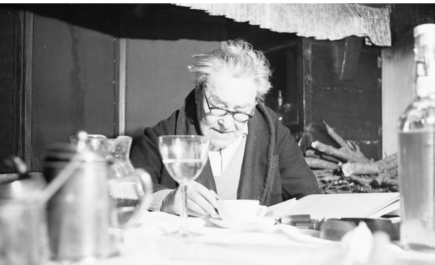
>> Josep Pla escrivint al seu mas de Llofriu el març del 1972.

La posició política que Josep Pla va mantenir al llarg de la dictadura del general Franco (1939-1975) ha estat motiu d'una viva polèmica que encara no ha finalitzat. És ben sabut que, durant la Guerra Civil, del 1936 al 1939, Pla va donar suport actiu al bàndol «nacional» i que des del seu exili (primer a Marsella i després a Roma) arribà a espisar en favor dels militars insurrectes.