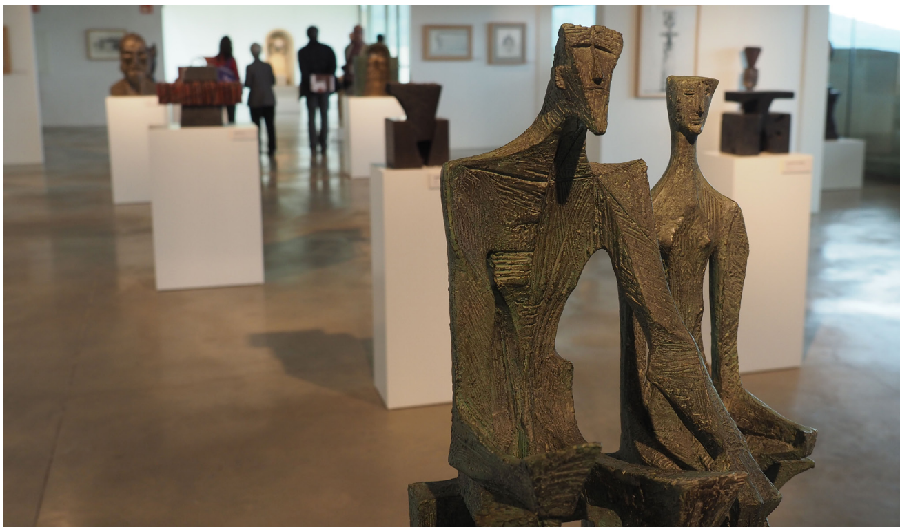
>> Sala d'exposicions temporals de La Fortalesa.

Gaudeix d'un espai propi, centre mundial de l'estrabotisme, no sabria dir si una derivada o una integral del surrealisme. L'espai és una mena de cub subterrani, una penombra a l'interior de La Fortalesa, on s'observa el treball del creador; obra acabada i obra fent-se. Grans teles de 12 x 6. Mentre escric, dues de les quatre parets ja tenen el seu quadre gegant i, una tercera està en procés.