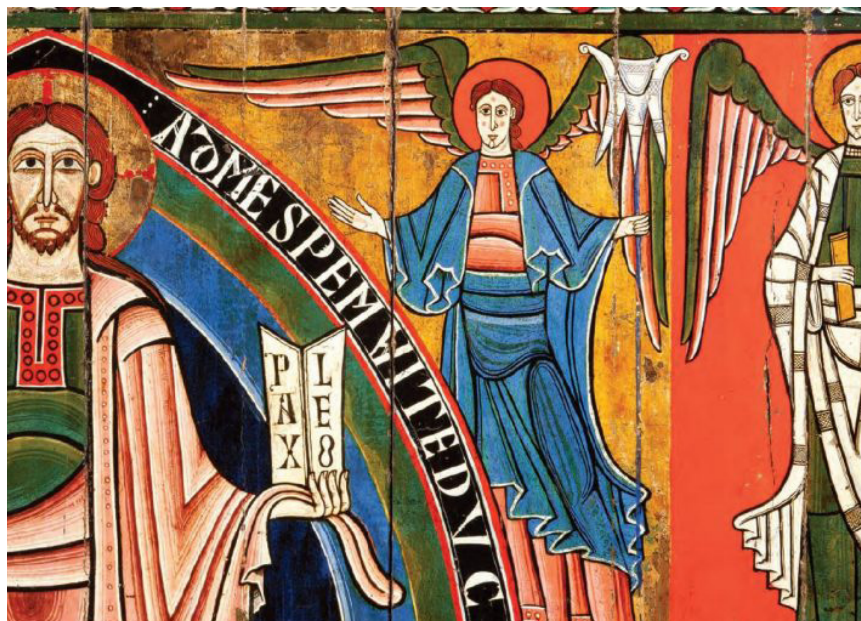
>> Imatge promocional del del cicle «Camins», centrada en la figura d'Oliba.

El dia 27 d'octubre, a Vic, es va cloure el cicle «Camins» amb la inauguració de l'exposició al MEV «Oliba episcopus», que proposa una visió renovada d'Oliba, el seu context i els diferents aspectes de la seva trajectòria, des de l'origen comtal, passant per la condició de monjo i abat, la consagració episcopal i les tasques pròpies del bis-