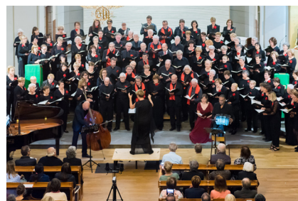
>> El Cor Transfronterer de Cerdanya canta la Misa a Buenos Aires de Palmeri a l'església de Sant Domènec de Puigcerdà.

Un cop més, el Cor Transfronterer de Cerdanya ha presentat un projecte que uneix cantaires i músics d'indrets diversos per treballar en una obra conjunta, en la qual es busca l'excel·lència d'un acabat professional.