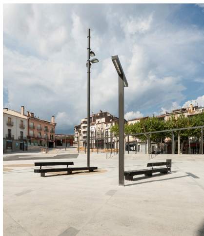
>> Imatge de la remodelació del passeig d'en Blay, conegut popularment com el Firal d'Olot.