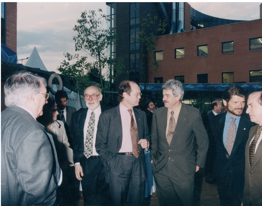
>> Inauguració de les noves instal·lacions del CETT.

El projecte de Gaspar Espuña per al CETT es caracteritzava perquè buscava ampliar la formació a tots els camps de l'activitat turística, atorgar-li un segell de qualitat i impregnar aquesta formació i la mateixa institució dels valors de l'humanisme cristià, amb un gran respecte per la diversitat ètnica, cultural i religiosa. És així com el CETT va esdevenir un grup empresarial (que també va promoure i gestionar Família Hotels), va tenir agència de viatges pròpia i va exercir una influència decisiva en l'organització d'ens a escala local (patronats, centres d'iniciatives turístiques...) dedicats a la promoció del turisme. Ara bé, l'expansió d'èxit del CETT va haver d'afrontar les limitacions de capital que li eren pròpies des de l'inici. Aviat trobà el suport dels empresaris de la Costa Brava Jordi Co-