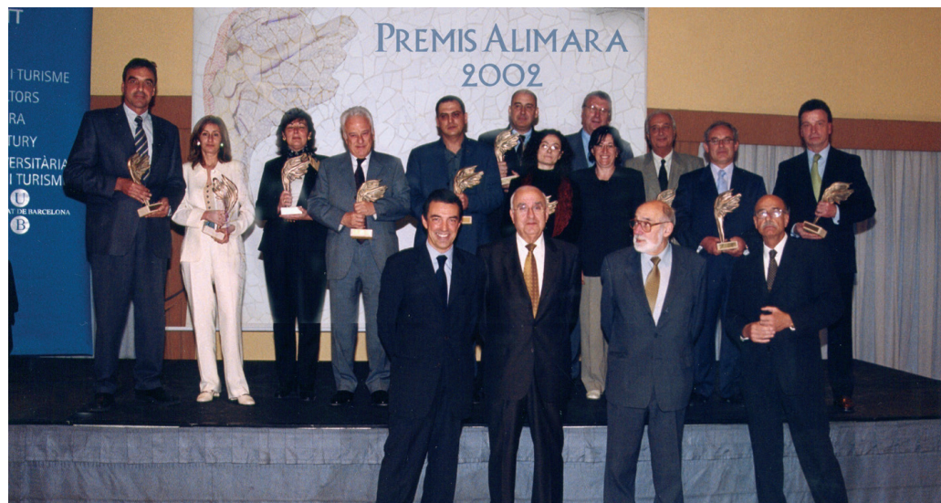
>> Concessió dels Premis Alimara.

Tres havien estat, en expressió personal, els seus impulsos vitals: «la meva fe, la vocació de servei al meu país, Catalunya, i la dedicació al món del turisme i de la formació».