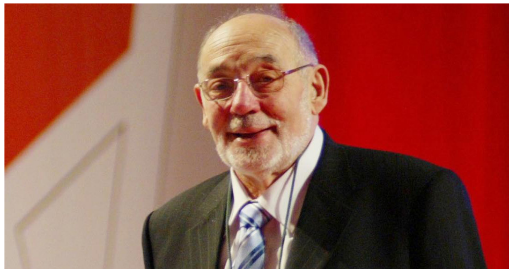
>> España després de rebre la Creu de Sant Jordi.