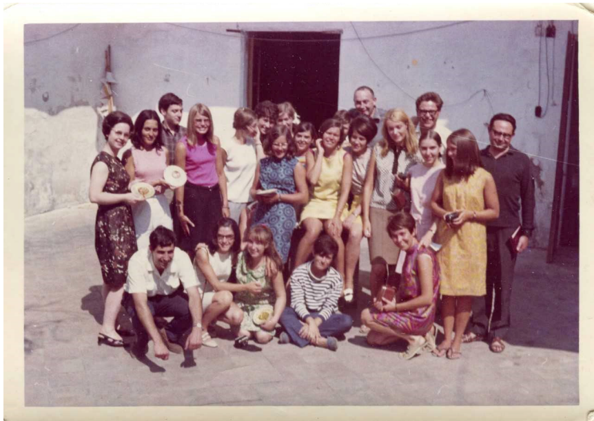
>> España amb un grup de participants a «Jovenut i turisme» el 1967.