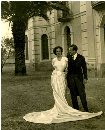
>> Casament a Fortianell, el 1947.

Sí. Em va venir a cercar l'Heribert Barrera, el 1977, perquè fos senador per Girona, a les primeres eleccions democràtiques, per la coalició Entesa dels Catalans, que agrupava el PSC-PSOE, el PSUC, ERC i independents. M'havia fet militant del partit, però