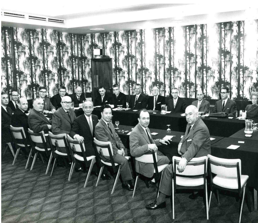
>> En una reunió a Londres, el 1960.

mai no m'havia pensat que em presentarien.