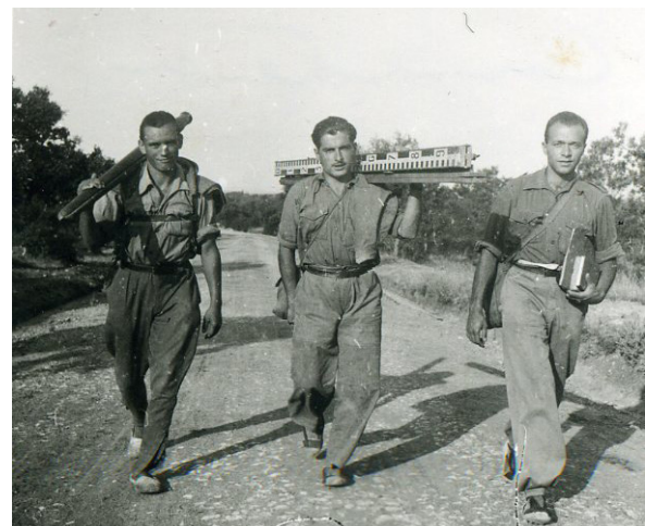
>> El 1932, al servei militar, traçant la carretera d'Avinyonet.