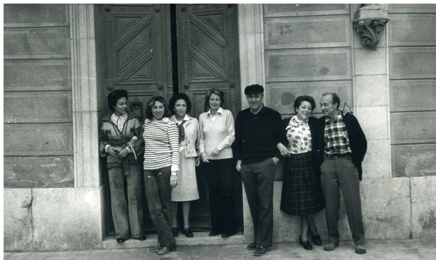
>> Els germans Rahola el 1978.