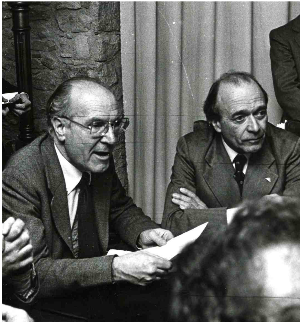
>> Reunió del Consell Nacional d'ERC, el 1980 a Girona.