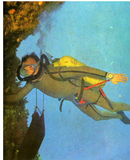
>> A les illes Medes, el 1963.