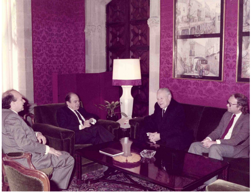
>> Amb Jordi Pujol i Josep Tarradellas, el 1980.

Molt importants. En va sortir la LOHAPA. I després va venir un sentiment molt fort contra Catalunya, de tot Espanya.