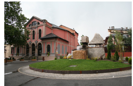
>> La plaça de Barcelona i la Casa Gran de Puigcerdà.

ha seguit invertint en l'arranjament de la vila i l'augment del seu patrimoni cultural. Al castell habitat per a les visites, cal afegir-hi els treballs d'excavació que es duen a terme a la part baixa del turó, on s'ha pogut localitzar el fòrum romà, just a tocar de l'església. Aquesta intervenció ha estimulat la creació d'un projecte de millora de l'espai que envolta l'església de Nostra Senyora dels Àngels, ja que ara mateix queda amagada rere els arbres i tant l'accés per les escales com el voltant de l'edifici estan força degradats. El projecte de millora preveu crear una zona enjardinada davant l'església i la millora dels accessos. L'objectiu final serà donar més visibilitat i protagonisme a l'església, així com unir aquest espai amb el del fòrum romà, on actualment treballen els arqueòlegs. Així doncs, Llivia segueix estudiant el seu passat i compartint el seu patrimoni cultural i arqueològic amb tots aquells que s'hi acosten.