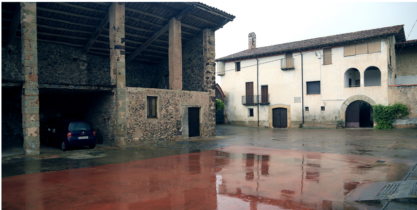
>> L'espai que ocupava la casa on va morir Francesc de Verntallat, just al davant del Molí de la Conquesta, al municipi de Sant Feliu de Pallerols.

ronella, espais vinculats a alguns setges dramàtics, com ara el que va patir la comunitat jueva el 1391, o, si ens cenyim a la guerra civil del segle xv, el que va tenir com a principals protagonistes la reina Joana i el fill primogènit, el futur Ferran d'Antequera, des del 15 de març fins al 23 de juliol de 1462. Si ens desplacem fins a la Vall de Llémèna, un altre escenari significatiu és el castell de Cartellà, declarat bé cultural d'interès nacional. Es tracta d'una magnífica fortalesa, actualment habilitada com a masia, que el 1470 va ser ocupada per les tropes de Verntallat i va patir el setge implacable de les de la Diputació. Si ens endinsem fins a la comarca del Pla de l'Estany trobem el castell de Falgons, a Sant Miquel de Campmajor. L'interior no és visitable, però es pot aprofitar l'Aplec de Sant Ferriol, que se celebra el segon diumenge de setembre, per arribar-hi.