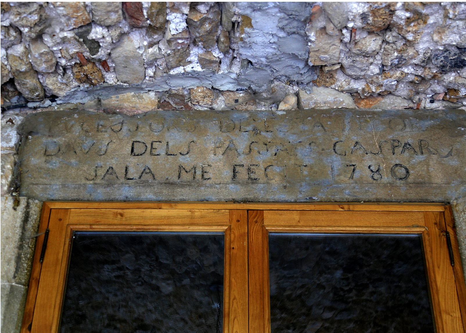
>> L'indar de la porta d'accés a Can Sala, amb una inscripció del 1780 que deixa testimoni de la nissaga dels Sala.

casa del veguer i la presó o casa del notari. El pujol en què es troba assentada la vila es converteix, a més a més, en una talaia privilegiada des de la qual es domina la vall i es poden resseguir els serrats i cingleres de l'entorn.