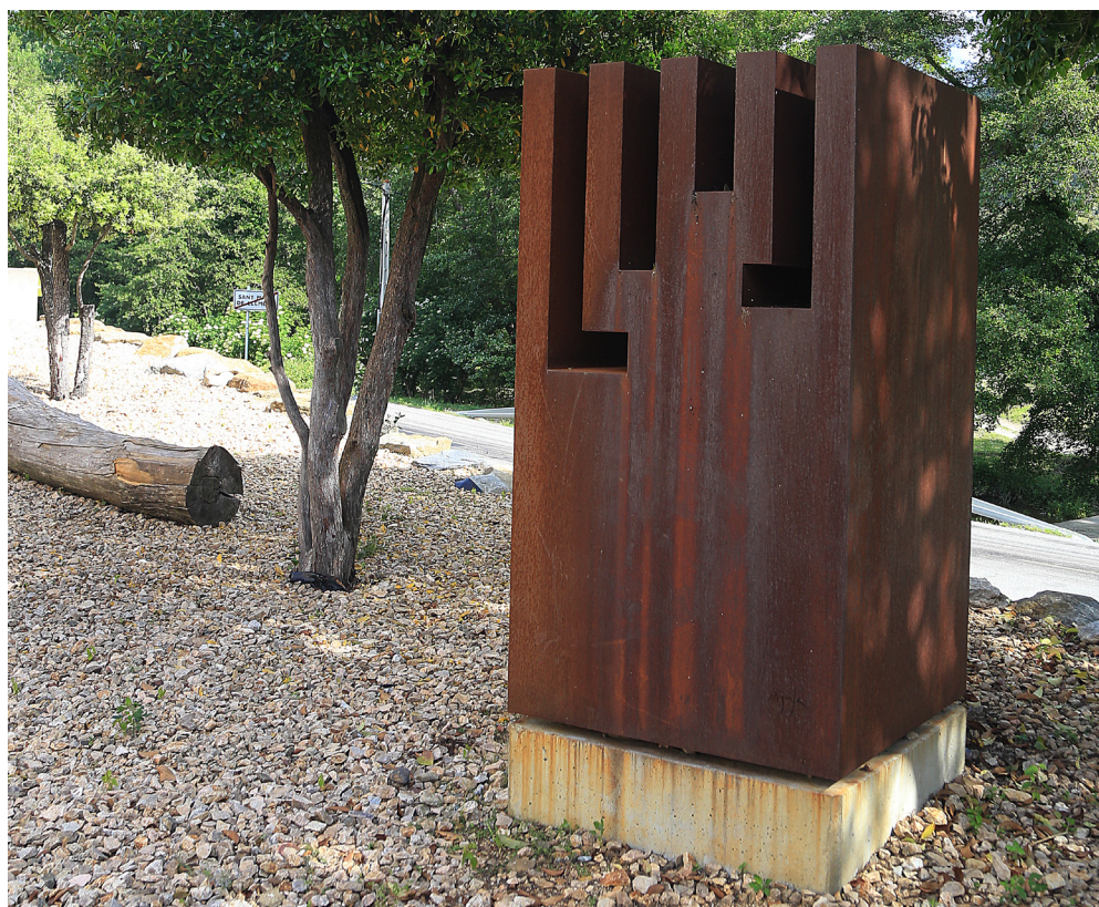
>> Escultura d'Alexis Alaya, a la Vall de Llémèna dedicada als remences i inaugurada el 2016, amb motiu de la Festa Remença. (Autoria: MANEL LLADÓ)