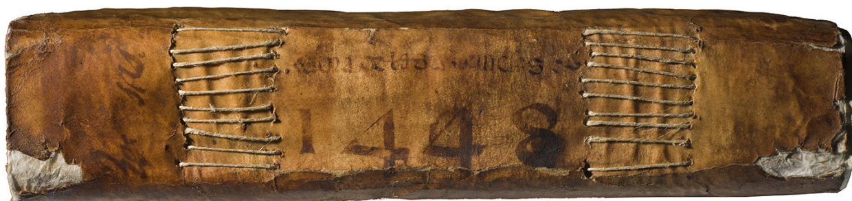
>> Llom del Llibre del Sindicat Remença de 1448.

En un context de revoltes pageses generalitzades a tot Europa, el Sindicat de 1448 va recollir la veu de més de 10.000 persones d'un mateix col·lectiu i d'un ampli territori. Un col·lectiu que, després de veure fracassar diversos intents de negociació, d'alçar-se en armes i de ser reprimat, va veure assoli-