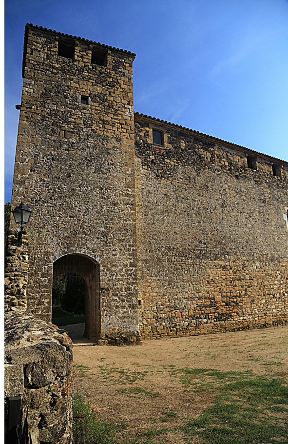
>> Castell de Cartellà. El 1470 va ser ocupat per les tropes de Verntallat i va patir el setge de les tropes de la Diputació. (Autoria: MANEL LLADÓ)

A diferència també d'aquests altres recomptes europeus fets la majoria de vegades per motius fiscals a iniciativa de les autoritats, el cens del Sindicat Remença de 1448, malgrat la participació dels oficials reials en la seva elaboració, va néixer de la voluntat dels remences de reclamar els seus drets, expressa la seva pròpia veu. El fracàs de les negociacions entre mo-