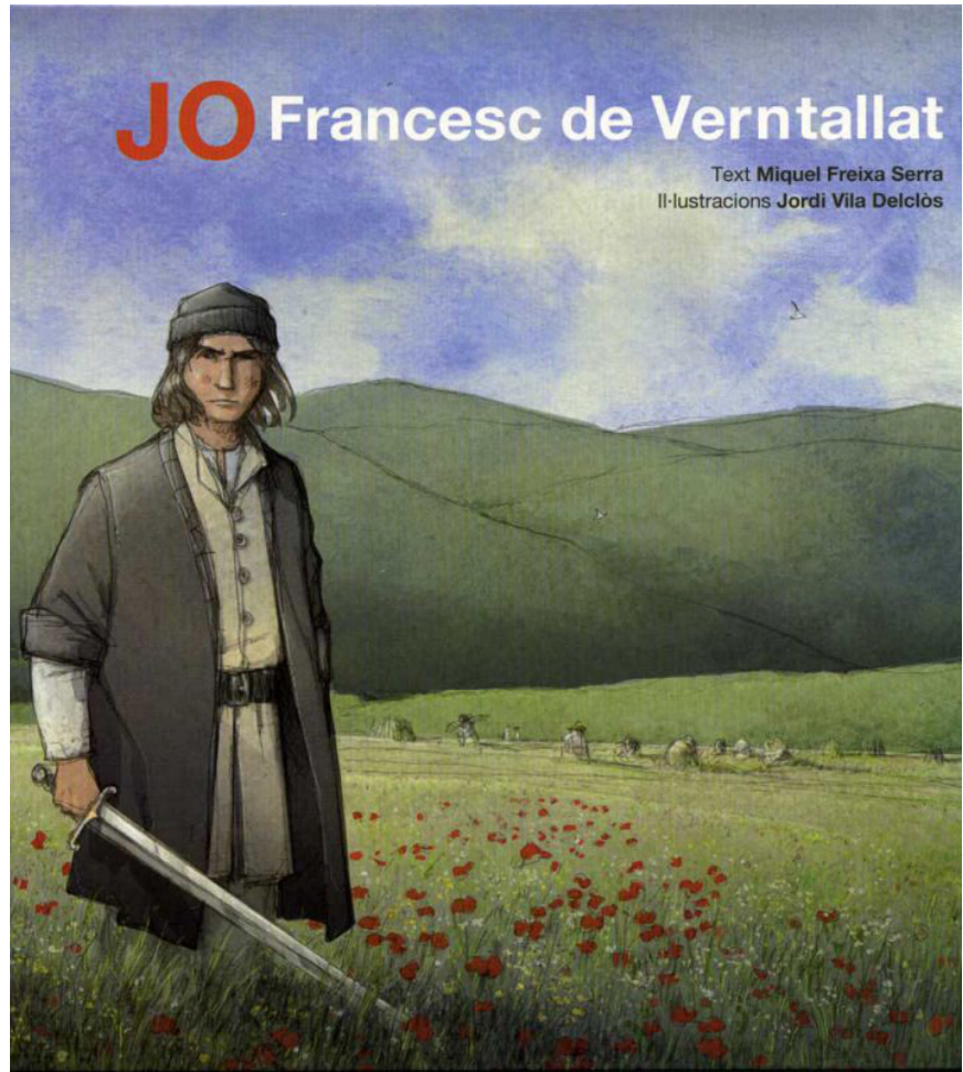
>> Jo, Francesc de Verntallat, de Miquel Freixa i Jordi Vila Delclòs (il·lustrador), Barcelona: Palahí, 2010. Obra breu i rigorosament històrica de divulgació. El text és sintètic i clar, i les il·lustracions estan geogràficament i històricament documentades.

Temps després va tornar a Sant Feliu de Pallerols. Hi ha diversos documents que ho acrediten. Però cal destacar-ne especialment un: es tracta d'un poder notarial que dona Verntallat al seu pa-