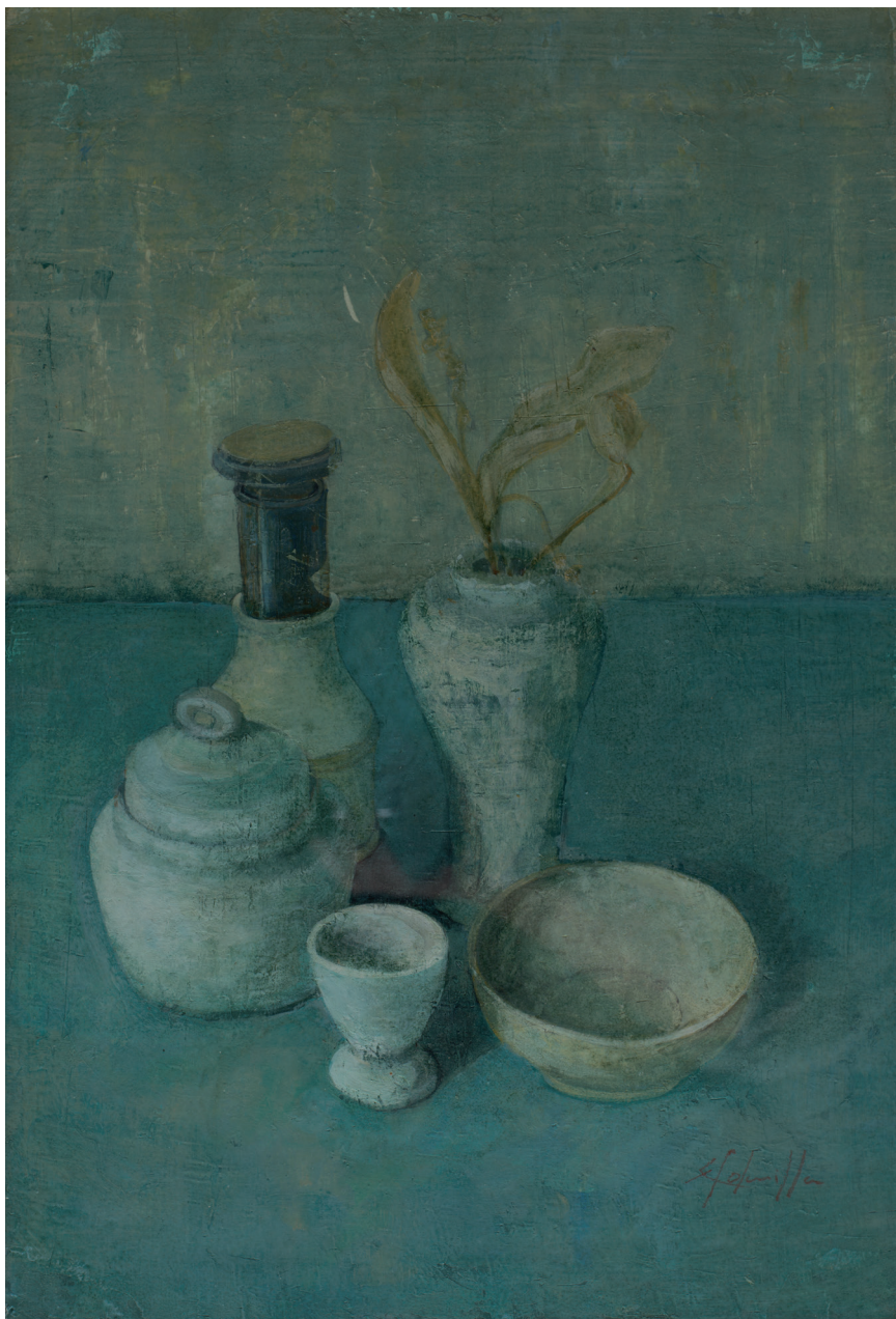
>> Natura morta. 1993. 48 x 32 cm. Acrílic sobre paper.

anar a l'Escola de Belles Arts, per on també han passat moltes generacions de garrotxins. Aquí ja era més gran i va passar del dibuix a llapis i carbonet, que acoloria amb pastels (matèries emprades bàsicament en l'etapa anterior), a pintar a l'oli, una tècnica més complexa. Recorda un seguit de mestres per als quals i per a l'ensenyament dels quals té molta gratitud, igual que per a l'etapa passada en el centre. Hi va fer fang i dibuixos esquemàtics de formes geomètriques que es van anar complicant en formes i cossos més complexos. Aquí es va iniciar en la tècnica del model al natural del nu femení. Totes aquestes pràctiques li han donat un bon bagatge.