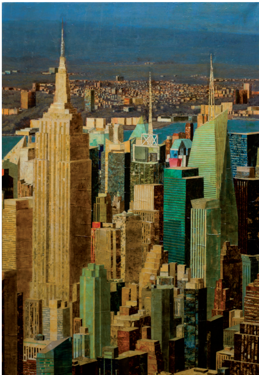
>> Empire State Building. 2018. 120 x 80 cm. Collage sobre tela.

https://www.instagram.com/enricsolanilla