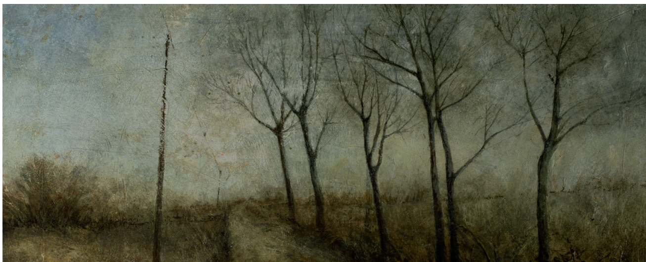
>> Camí. 2016. 30,5 x 63,5 cm. Acrílic sobre fusta.