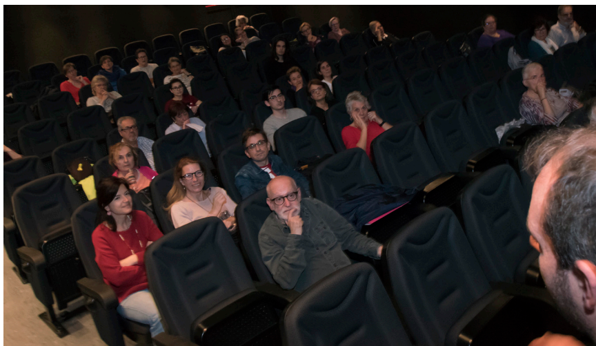
>> Xerrada prèvia a una projecció al Truffaut. (Autoria: CLAUDI VALENTÍ)