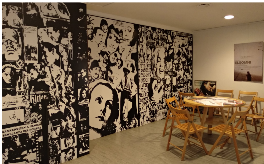
>> Una sala del Truffaut amb referències cinematogràfiques.

què a vegades ve a veure una pel·lícula i es troba que aquell dia no la passem». Les distribuïdores també exigeixen un mínim de projeccions en un temps determinat, que alguna vegada no es poden complir per manca d'espai. «Tot i que ho entenen, és clar que fan falta dues sales.»