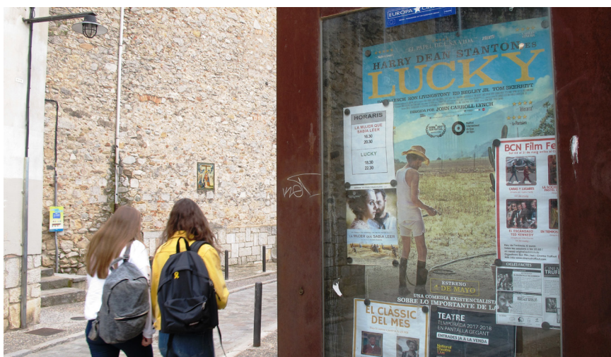
>> Cartellera exterior del Cinema Truffaut.