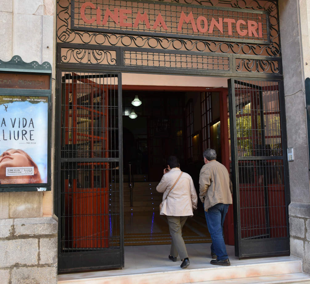
>> Una parella entra al Cinema Montgrí.

Així, en general, la idea que llavors animava els impulsors dels cineclubs no difereix gaire de la d'avui dia: es tractava de fer arribar als espectadors pel·lícules que no es veien als cinemes comercials. Els cinèfils que hi havia darrere cada cineclub consideraven que el cinema podia transcendir el simple entreteniment, que a través de moltes pel·lícules i cinematografies diverses es podien plantejar debats sobre temes d'actualitat o sobre el setè art mateix. A això caldria afegir-hi el context de cada època. Als anys del franquisme el cineclub es convertia en un refugi de llibertat cultural enfront de la repressió i la censura, mentre que actualment és més un espai on es compensa la manca de diversitat cinematogràfica de les grans multisales, si bé persisteix l'oportunitat de conèixer i analitzar cultures i realitats a les quals el públic no té accés pels canals de comunicació convencionals.