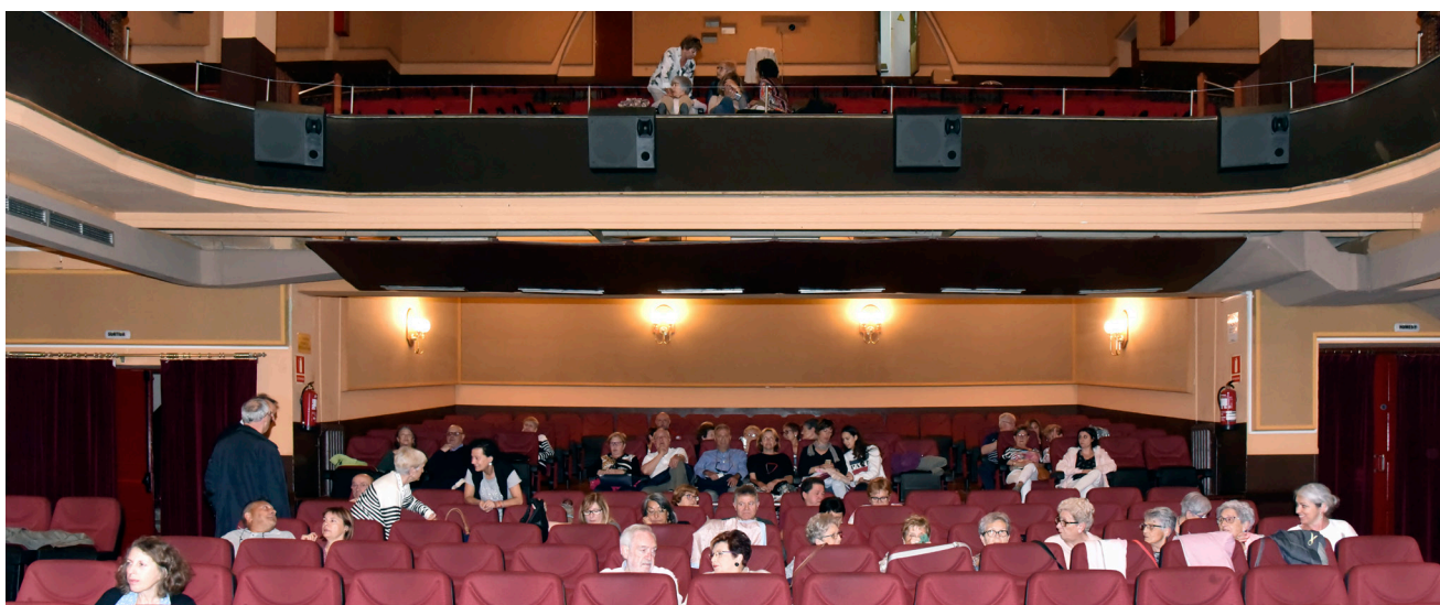
>> Platea i amfiteatre del Cinema Montgrí, en una sessió de diumenge a la tarda. (Autoria: CLAUDI VALENTÍ)