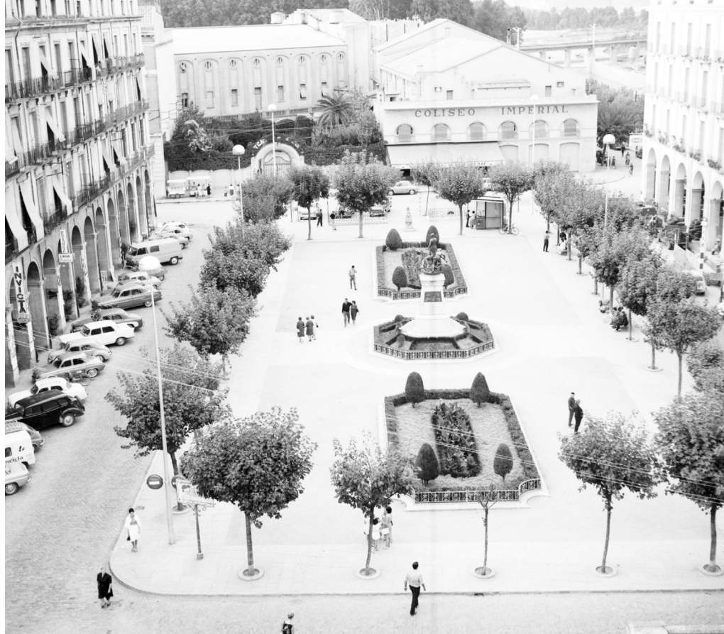
>> Vista de la plaça de Sant Agustí, coneguda popularment com la plaça dels cines, als anys seixanta.

Des dels primers anys del segle xx i fins a inicis dels anys quaranta, les tres grans sales de la plaça dels cines acaparaven el negoci de l'exhibició i es pro-