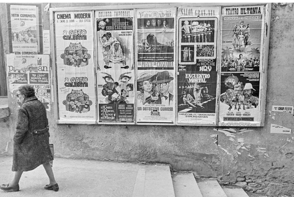
>> Cartells del Cinema Modern, del Coliseo Imperial, del Teatre Albèniz, del Saló Gran Via i del Teatre Ultònia a les escales del pont de Sant Agustí als anys seixanta.