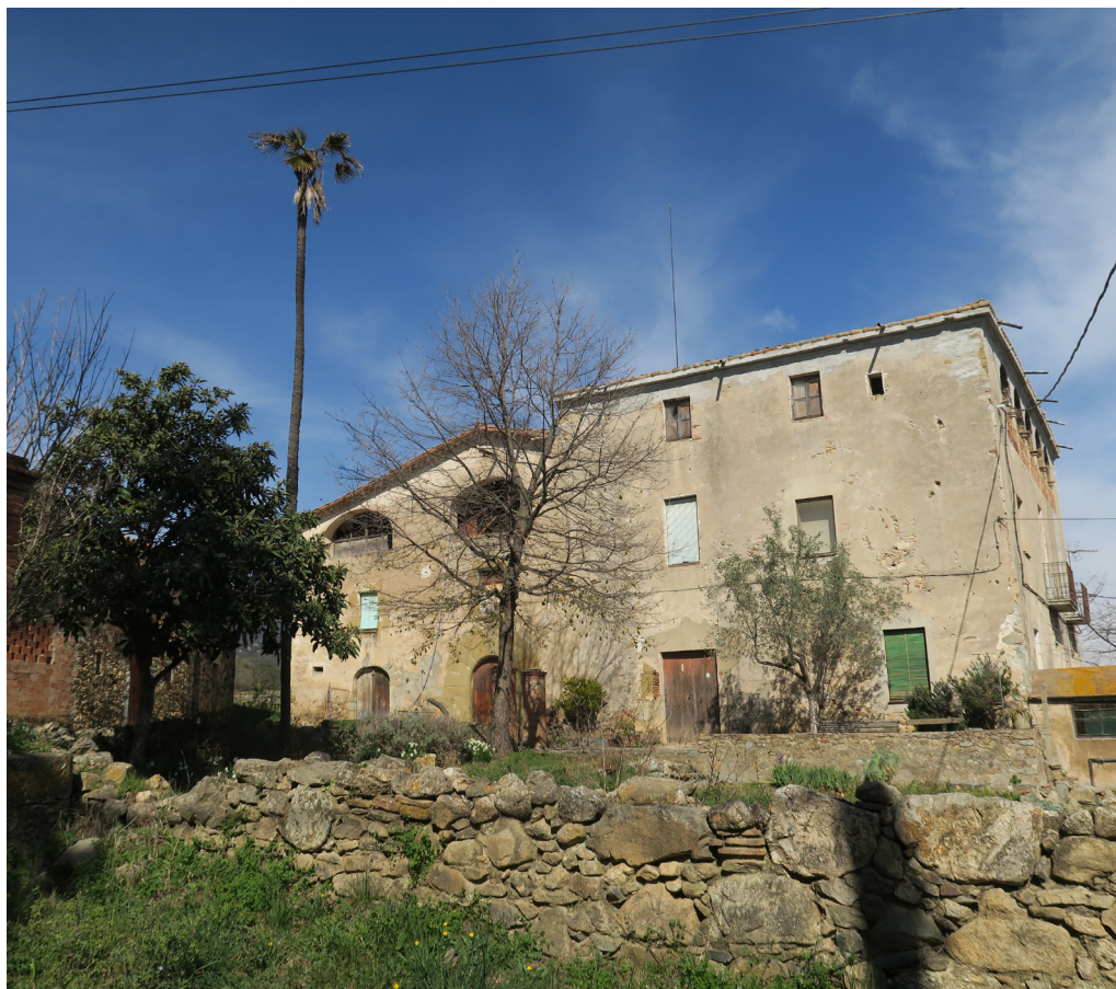
>> Façana sud del Mas Vinyes. (Autoria: LLUÍS CODINA)

A part de la seva intensa dedicació a la botànica, especialment a la micologia, Codina no deixà la seva tasca com a metge rural (i batlle i jutge de pau, un temps), de manera que podem afirmar que va començar sent un metge botànic i va acabar esdevenint un botànic metge.