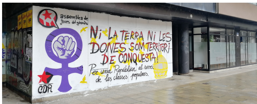
>> Mural representatiu de les reivindicacions del 8-M a Girona. (Autoria: DANI VIVERN)

L'art urbà | L'artista B-Toy ha creat una pintura de grans dimensions en una paret lateral del Museu dels Sants d'Olot. És una de les deu artistes comissariades per l'Associació Rebobinat dins del projecte «Womart», guanyador del Concurs de Comissariat impulsat l'any 2017 pel Consorci Transversal Xarxa d'Activitats Culturals. El projecte agrupa deu ciutats catalanes amb la voluntat de fer-hi visible l'art urbà fet per deu dones, que es vol valorar especialment, ja que massa sovint el talent artístic de les dones creadores ha estat silenciada. En aquest mural la seva creadora, que ha fet pintures murals de grans dimensions en ciutats d'arreu del món, s'ha inspirat a partir del rostre d'una treballadora del taller d'imatgeria religiosa, ubicat en el mateix edifici del Museu dels Sants, i fa un homenatge a les treballadores dels tallers de sants d'Olot.