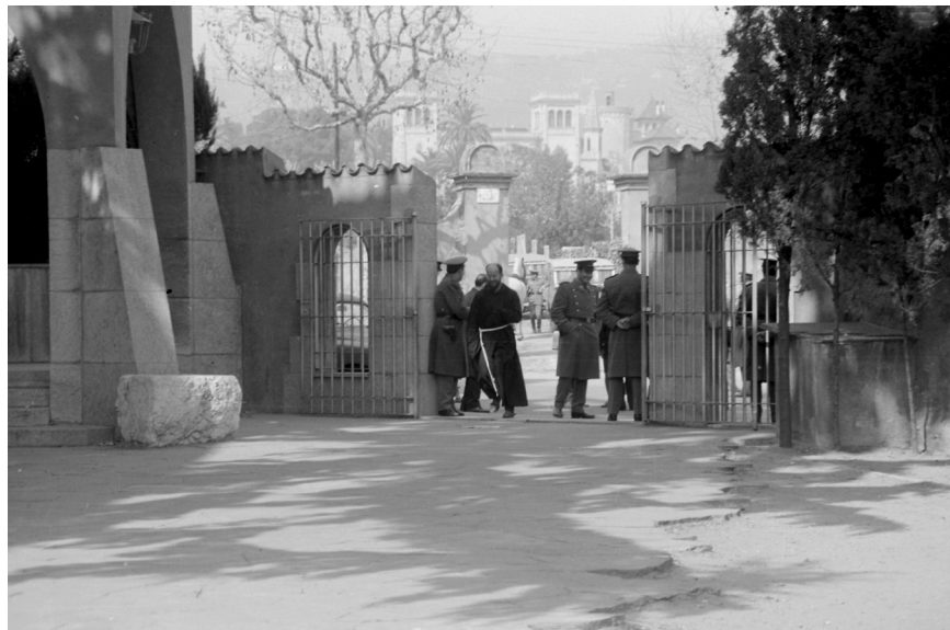
>> El pare caputxí Joan Botam conversa amb els agents de la policia que encerclen el convent dels Caputxins.

La tancada es va perllongar durant tres dies. I es produí en unes condicions precàries: amb el setge perma-