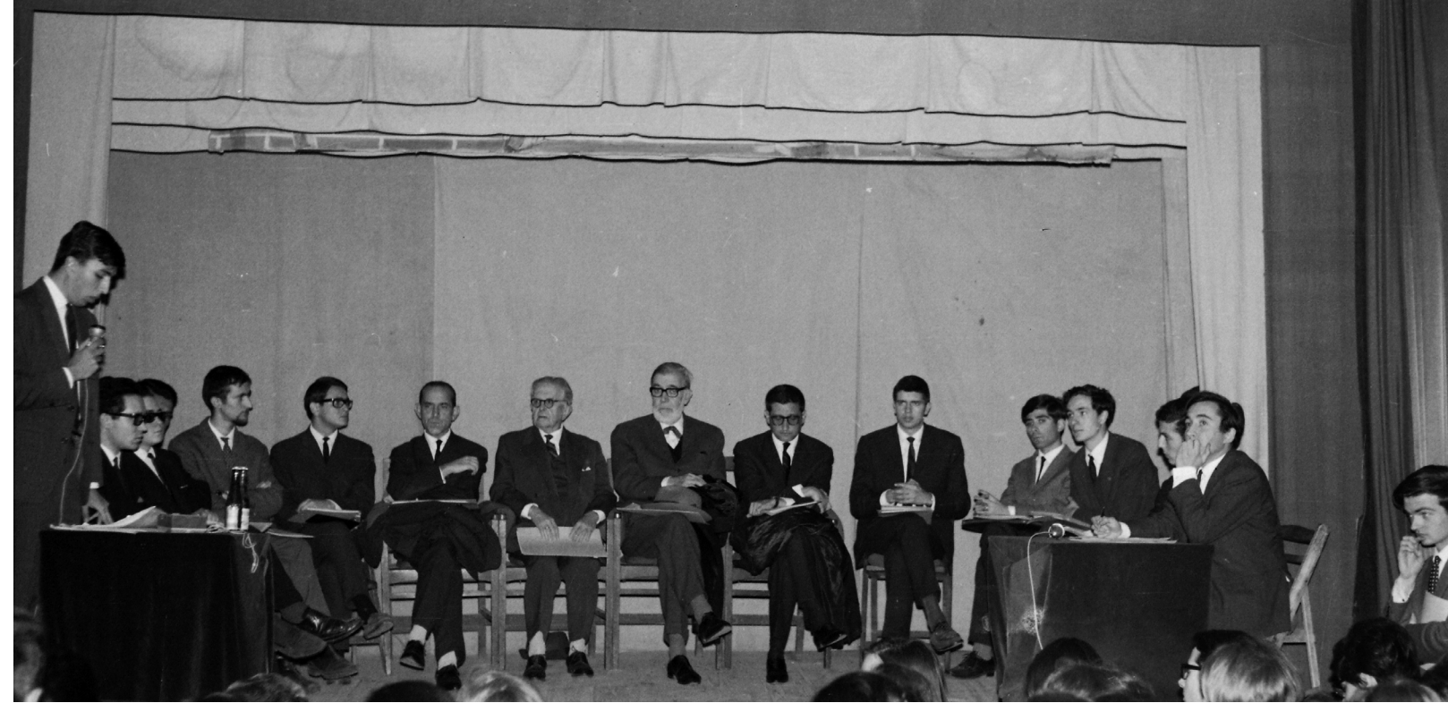
>> La taula presidencial de l'assemblea del Sindicat Democràtic.