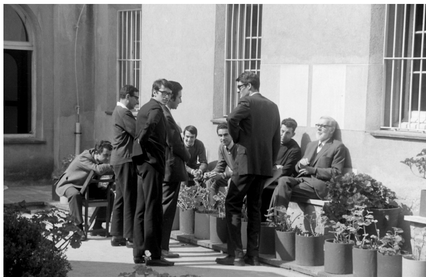
>> L'escriptor Pere Quart parlant amb alguns estudiants al pati del convent. (Autoria: GUILLEM MARTÍNEZ)

sava de manifest, ben clarament, el divorci entre l'Estat franquista i un sector de l'Església catalana: «¿Cuántas veces hemos oído y leído elogios sin reserva para aquellas personas eclesiásticas e instituciones que han manifestado su aprobación a la política del Gobierno! ¿Será pues, verdad, que la repetida fidelidad del Estado español a la Iglesia está condicionada por la fidelidad de ésta a los intereses de aquél?».