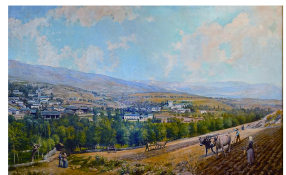
>> Vista de Bolvir, quadre de Pere Borrell.

Aquesta obra formarà part de la col·lecció de l'Ajuntament de Bolvir i es podrà visitar a la sala de plens.