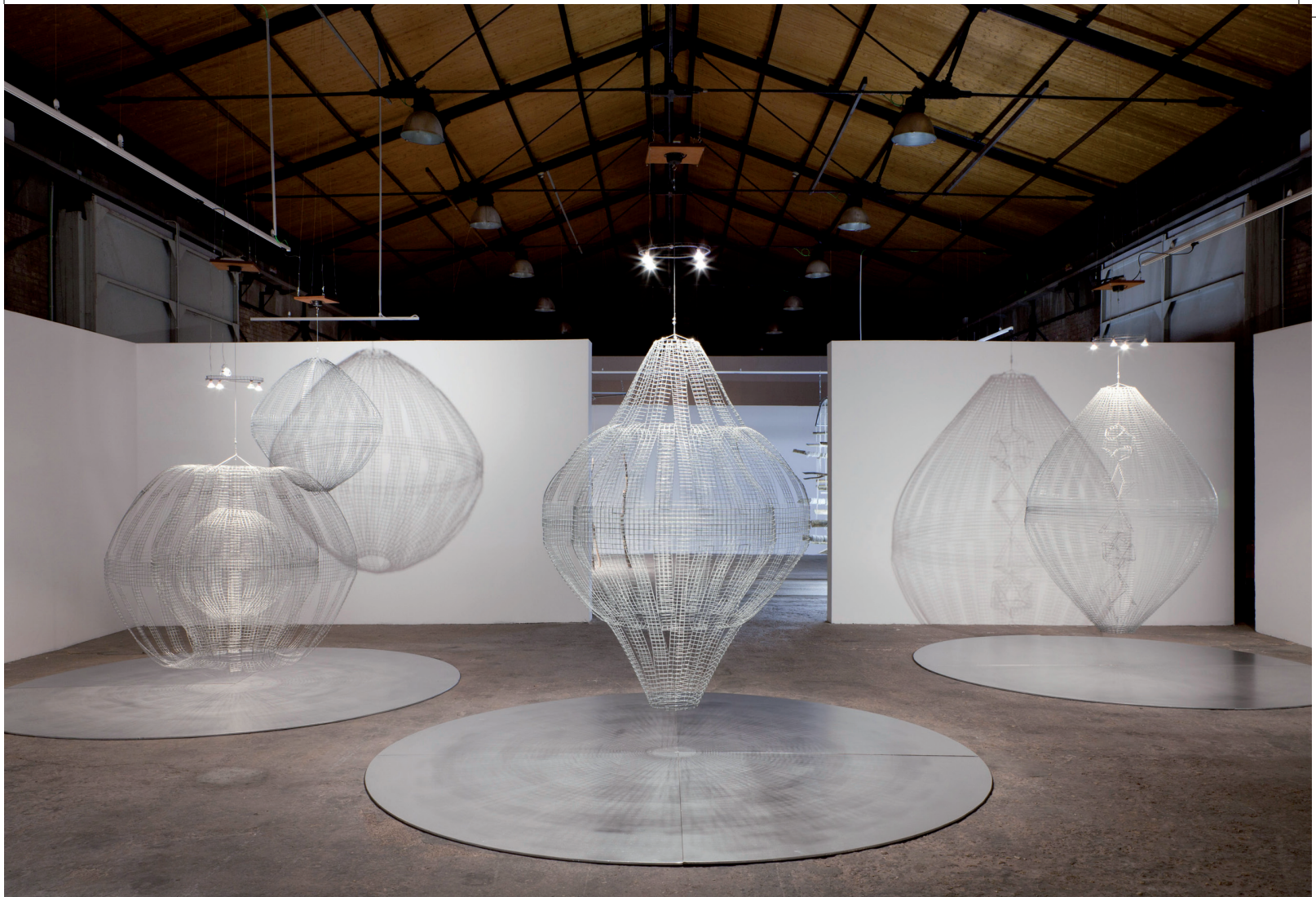
>> «Penjar d'un fil», 2007-2011. Malla de ferro electrogalvanitzada, motors giratoris, llum, planxes de fusta de 330 cm de diàmetre pintades. 160 × 180 cm de diàmetre, dos de 200 × 160 cm de diàmetre, 160 × 160 × 160 cm, 110 × 130 cm de diàmetre, 120 × 120 × 120 cm, i 90 × 90 × 90 cm. Exposició «Cossos» al Tinglado 2, Tarragona, 2014.

E ncara que va néixer a la comarca de la Selva, quan tenia pocs mesos va anar a viure amb els avis materns a les Preses, i aquí hi va passar els primers anys de vida. Rememora (més pel que li han explicat i per alguna fotografia que hi ha a casa seva que pels records que en conserva) que de molt petita ja dibuixava amb un bastó sobre la terra i la sorra dels carrers del poble que encara no estaven asfaltats, i quan tenia un dibuix fet, hi passava el peu per esborrar-lo i continuar fent nous grafismes. La vida dels anys cinquanta a la població era tot placidesa, i més per a una criatura que gaudia de tota la llibertat del món per anar a buscar flors i plantes, per apropar-se al riu a veure crancs i peixos, moltes i falgueres, o per escoltar els ocells que niaven sota el ràfec de les cases veïnes.