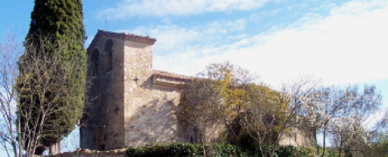
>> Església dels Sants Just i Pastor. Veïnat de Pedrinyà (Crespià).

poble havia de tenir-ne, governades per un alcalde o batlle, amb un consell de regidors i amb la tutela dels poders borbònics. Però aquest model castellà no havia suprimit l'Antic Règim, que donava atribucions als senyors acomodats dels pobles per nomenar els batlles del seu municipi.